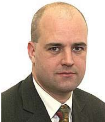
Den svenske statsminister Fredrik Reinfeldt forbereder NATO-medlemskab

flanke sårbar over for opbygningen af NATO's militære infrastruktur og uden en buffer mod luft- og missilangreb.