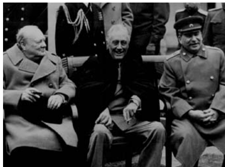
Jalta, februar 1945

Regeringerne i alle andre af Tyskland besejrede lande gjorde den ene af disse ting eller begge. Den polske regering – racistisk, antikommunistisk og ultranationalistisk – kort sagt så slem