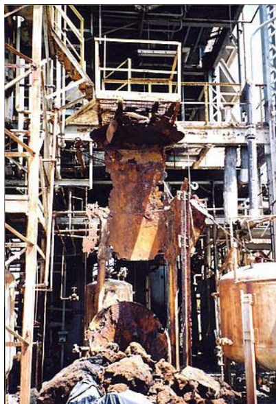
Ruinerne af det amerikanske industrikompleks i Indien, der den 3. december 1984 forgiftede en halv million mennesker, og slog tusinder ihjel.

Medical Appeal og The Yes Men, bl.a. finansieret af Bono. For fem år siden stod de frem på BBC som repræsentanter for Dow Chemical og annoncerede at efter 20 år ville firmaet endelig rydde op efter ulykken. Det kom til at koste firmaeten aktionedturl på to milliarder dollars. Episoden vises i filmen " The Yes men Fix The World ", der blev præsenteret på Sundance filmfestivalen i januar og får premiere i de britiske biografteater den 11. august.