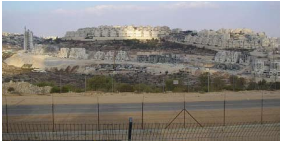
Israelske bosættelse på Abu Ghneim bjerget

nationale skandaleombruste Nestlé blevet hovedaktionær i Osem Group med en aktiepost på 51 %. Dermed har den zionistiske besættelsesmagt fået stillet både kapital og endnu et verdensomspændende distributionsnet til rådighed.