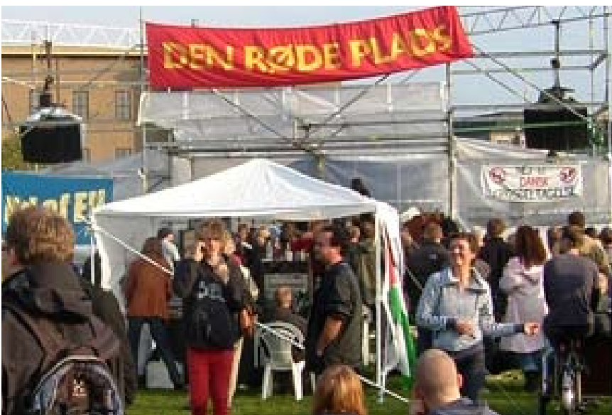
1. maj på den Røde Plads i København

Danmarks deltagelse i krigen i Irak og Afghanistan er katastrofale. Hundretusinder af mennesker er døde. Den sikkerhed, fred og det fremskridt, der