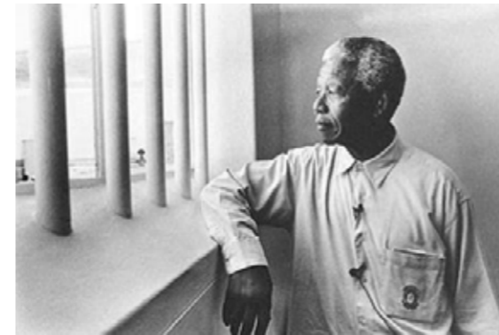
Nelson Mandela: Dømt terrorist