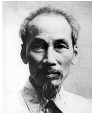
Ho Chi Minh: Dømt terrorist

Aktiverne fra Fighters+Lovers blev idømt mellem 2 og 6 måneders betinget fængsel.