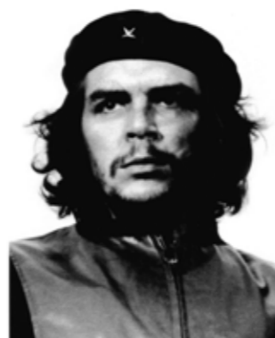
Che Guevara: Henrettet terrorist