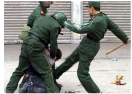
Fra Longnan, Kina, november 2008

”Man kan faktisk, hvis man vil have et dystert indtryk, hænge et verdenskort op på væggen og begynde at indsætte røde nåle, hvor voldelige episoder allerede har fundet sted: Athen (Grækenland), Longnan (Kina), Port-au-Prince (Haiti), Riga (Letland), Santa Cruz (Bolivia), Sofia (Bulgarien), Vilnius (Litauen) og Vladivostok (Rusland) kunne være en begyndelse. Mange