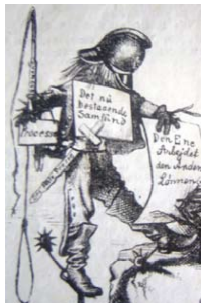
Detalje: Det nu bestående samfund – med pisk, processer, "fri presse" og den ene der gør arbejdet, og den anden der høster lønnen

Frem af en afgrund, stinkende og dyb, hvor grådigt gribben sig i ådslet mætter, hvor der er liv kun for det usle kryb, hvor hele idealet er – skeletter. Der hvor naturens råhed er fornuften, og ubarmhjertighed er æresgæsten, hvor råddenskaben har besvangret luften, og i ubændig elskov avlet – pesten.