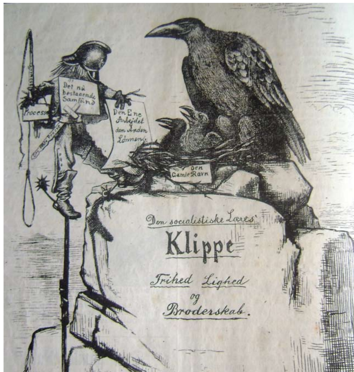
Tegning og digt fra Den gamle Ravn (1877-78)

Men dommen lød: "Så længe folket léd, og salte tårer uskylds kinder væded', skal grusomhed og uretfærdighed i kompagni beklæde dommersædet. Og hadets gift skal smitte mange tunger, uskyldighed skal brødens straf udsone, så længe denne ånd, hvis navn er h u n g e r, tør føre scepter, og tør bære krone.