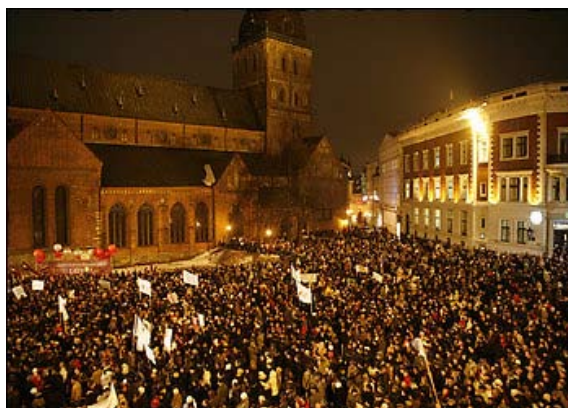
Masseprotest i Riga mod regeringen

Et sammenbrud i ejendomspriserne og en kraftig svækkelse af økonomien i Central- og Østeuropa (CEE-landene) vil øge eurolandenes offentlige gældssætning og føre til betydelige tab for bankerne i Europa. Det forudser Danske Bank.