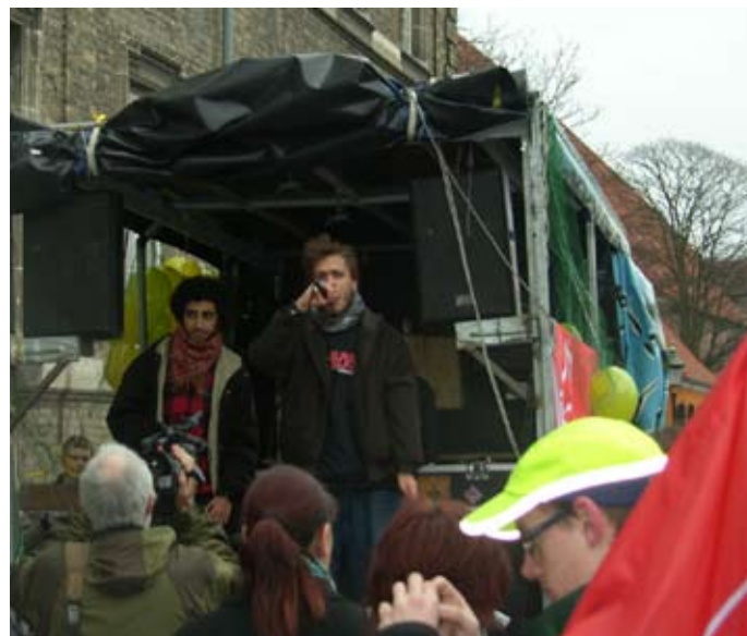
500 lærlinge og elever fra landets tekniske skoler blokerede fredag den 6. marts Bertel Haarder og hans ministerium med kravet om 'Lærepladser til alle' – nu!