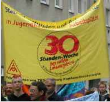
Tyske arbejdere i kamp for nedsat arbejdstid 2006