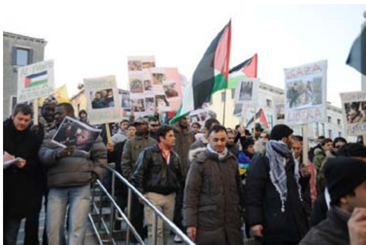
10.000 i Venezia 10. januar