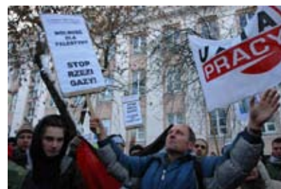
Warszawa 10. januar