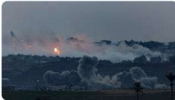
Hvid fosforbombe over Gaza

"Palæstinensisk blod er ikke ofret forgæves, og med guds hjælp vil vi vinde sejr," sagde han. Han kaldte Gaza-boernes modstand indtil nu for 'et mirakel'