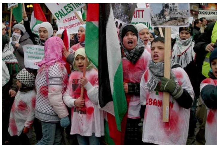
40.000 i Oslo 8. januar