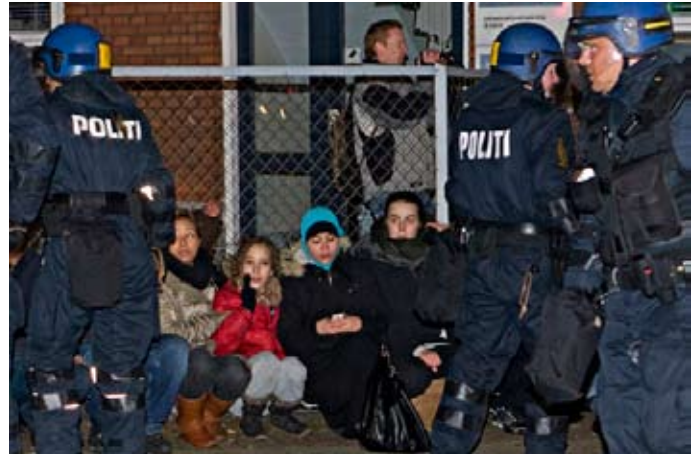
Anholdt af politiet ved Hellerup station efter demonstrationen ved Israels ambassade 4. januar 2008.

Langs indersiden af hegnet stod nogle børn, så vidt jeg kunne se i 10-12 årsalderen; de var øjensynlig også taget til fange. Uden for hegnet stod mennesker, som ikke var blevet fanget, og derfor var på så fri fod, som man kan være det under de i nutiden herskende