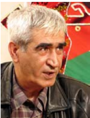
Ahmad Sa'adat PFLPs fængslede generalsekretær

Kammerat Ahmad Sa'adat, den fængslede generalsekretær for Folkefronten til Palæstinas Befrielse, udsendte den 5. januar en erklæring fra sin fængselscelle, hvor han opfordrer til, at Gaza bliver til en kirkegård for besættelse, og til, at den palæstinensiske modstand forener sig og retter slag mod besættelsen overalt, hvor den kan, for at besejre fjenden.