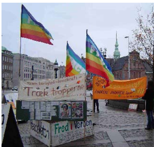
Fredsvagten ved Christiansborg har stået der dagligt siden USA og villige angreb Afghanistan i 2001

FredsVagten har hen over julen haft en 'nabo' i form af et 'Midlertidigt Monument for faldne danske soldater'. På et stort stykke papir havde man opregnet de danskere, der er døde i oversøisk tjeneste for vort land, flankeret med blomster og kirkegårdslys. Monumentet er d.d. fjernet.