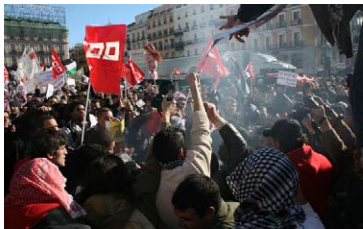
250.000 Madrid 11. januar