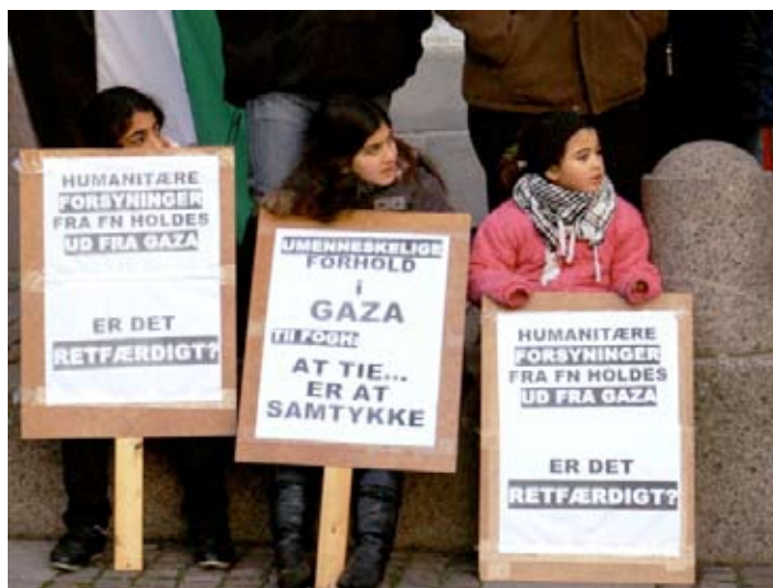
Flakhaven Odense 29. december 2008

USA støtter Israels undertrykkelse af det palæstinensiske oprør, fordi palæstinerens kamp for frihed, politiske rettigheder og et værdigt liv i eget land er et stærkt symbol. Det er et stærkt symbol for den kamp alle frihedselvende folk i mellemøsten burde føre mod USA-støttede fundamentalistiske regimer og amerikanske marinesoldater, der har besat mellemøsten for at stjæle og sælge olien.