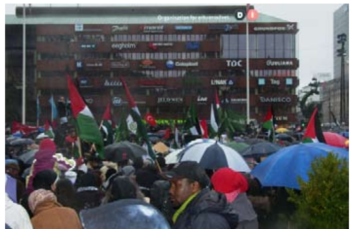
Gaza-demo fra Rådhuspladsen i København til Christiansborg 3. januar 2009 - i massivt regnvejr