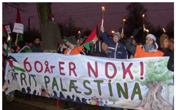
Demonstration den 28. december ved Israels ambassade i København