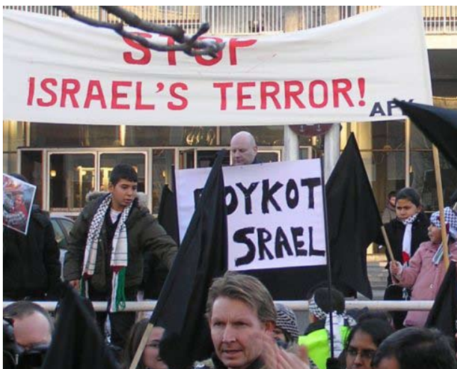
Fra Gaza-demonstration i Århus 2. januar 2009

Oversat af Kommunistisk Politik efter Russia Today 29. december 2008