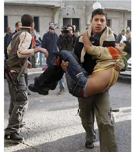
Dreng såret af israelske bombe angreb

De israelske luftangreb i dag og de katastrofale menneskelige tab, de har forårsaget, udfordrer de lande, der har været og vedbliver at være medskyldige, enten direkte eller indirekte, i Israels krænkelser af international lov. Denne medskyld inkluderer, at disse lande fuldt bevidst leverer det militære udstyr, inklusive krigsfly og missiler, der bliver brugt i de ulovlige angreb, såvel som, at disse lande har