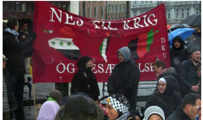
Demonstration i København den 3. januar