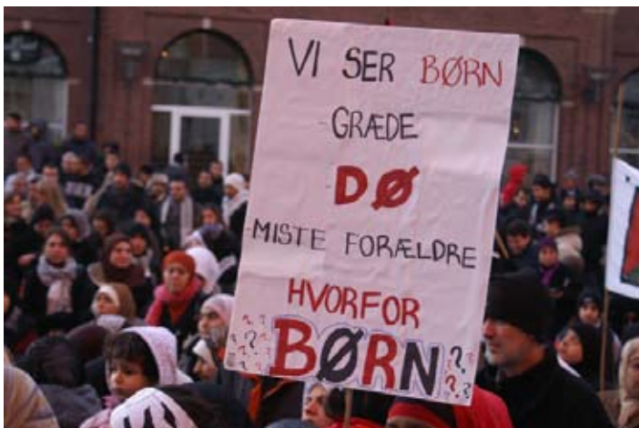
Fra Gaza-demonstration i Århus 2. januar 2009