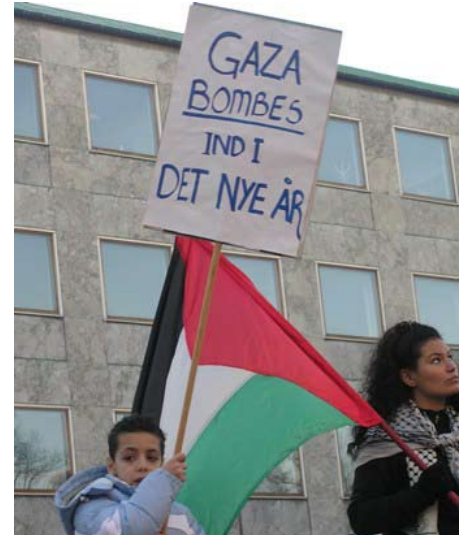
Fra Gaza-demonstration i Århus 2. januar 2009