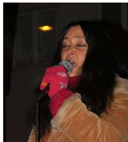
Annisette ved protestdemonstrationen 4. januar 2008.