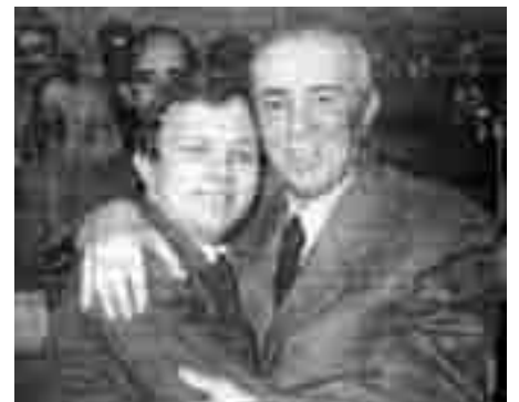
Enver Hoxha og Klaus Riis, dengang formand for DKP/ML, under Albaniens Arbejdets Partis 8. kongres i 1981, den sidste hvor Enver Hoxha deltog

Franz Krejbjerg fra APKs ledelse behandlede i sit oplæg først og fremmest Enver Hoxhas analyse af imperialismen i slutningen af sidste århundrede og med udgangspunkt i hovedværket ’Imperialismen og revolutionen’ og påviste dens aktualitet og gyldighed i