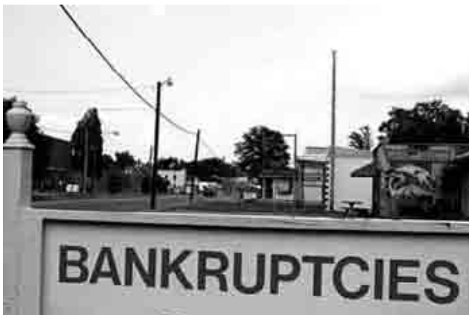
De seneste måneder har USA sat nye konkurs-rekorder. Regningen sendes til arbejderne.

4. Større efterspørgsel og hurtigere omsætning kan fremmes af handelskapitalen og finanskapitalen. Den første gør varerne mere tilgængelige og attraktive, den sidste bidrager ved at yde kredit i stor skala (i opgangstider) til almindelige arbejdende mennesker oven i kreditten til industrikapitalen. (Denne arbejdsdeling mellem forskellige former for kapital medfører skærpet kamp om merværdien, men det vil vi ikke