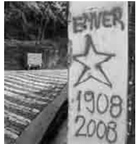
Graffiti i Gjirokastra

Men heller ikke Enver Hoxhas parti kunne ikke modstå den enorme kontrarevolutionære bølge, som skyllede gennem Europa i årene 1989-91. Albanien Arbejdets Parti forvandlede sig selv til et socialdemokratisk parti, fik et klart parlamentarisk flertal i 1991 og blev derefter blev skyllet af banen af den åbne og rasende amerikanske og EU-støttede kontrarevolution, indtil marionetten Sali Berisha blev indsat, og Albanien forvandling til kasi-noøkonomi, narkobule og bordel tog fart