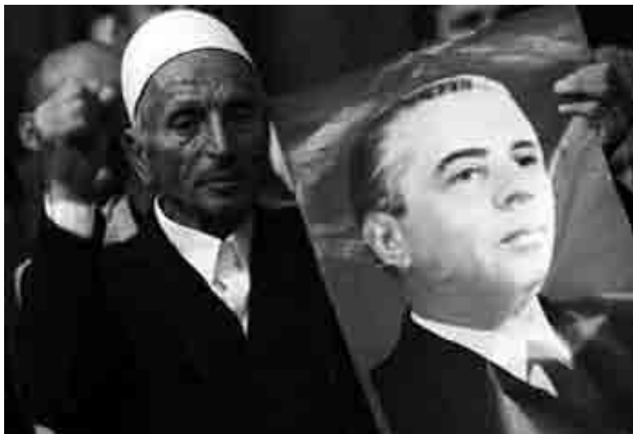
Enver Hoxha 100 år

Det er helt centrale teoretiske værker som 'Imperialismen og revolutionen' – et blændende forsvar for leninismen og et videnskabeligt opgør med den kinesiske revisionisme – eller 'Eurokommunisme er antikommunisme' med dens kritik af 'socialismen uden revolution'