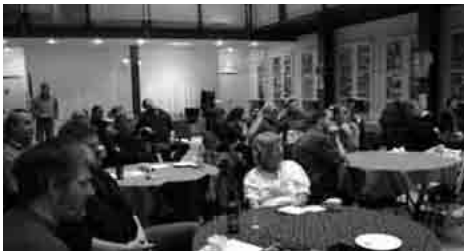
Et velbesøgt festmøde med mange unge