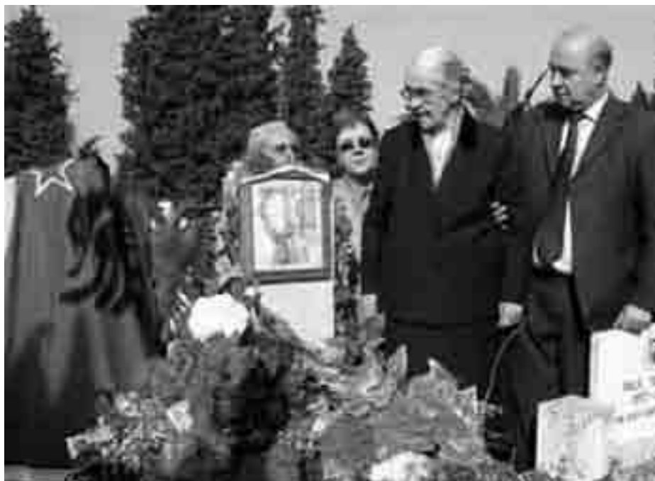
Nexhmije Hoxha sammen med børn og kommunistiske kammerater ved Enver Hoxhas grav på 100-årsdagen 16. oktober

andre rundt beretter om positive ting, men medierne bortcensurerer dem. Det er ret vildt, at de er bange for en død 'diktator'. Enver Hoxhas magt består ikke i, hvad der fremkommer i medierne, men det som han gjorde for sit folk,