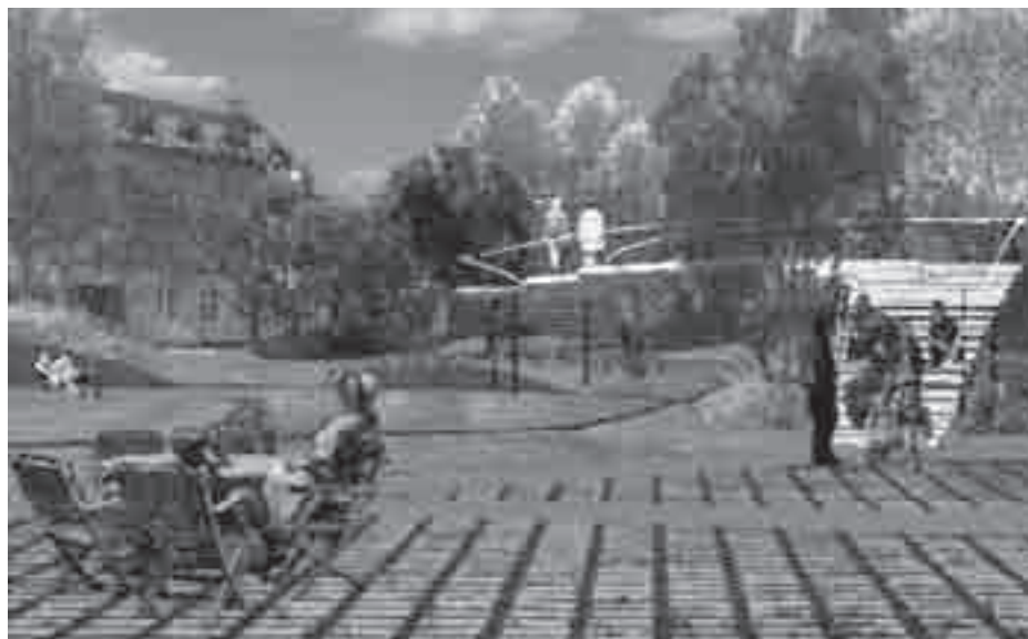
Projekttegning af den renoverede park med den store gangbro

Folkets Park er siden 1. maj 1971 en oase på Nørrebro, da slumstormere og beboere i protest mod Den Sorte Fir-kants slum og planlagte totalsaneringer