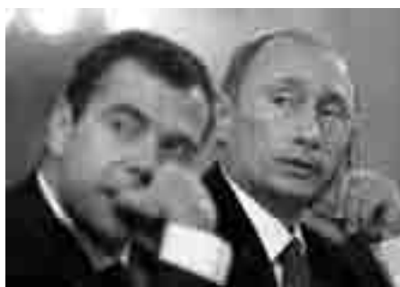
De to stærke mænd i Rusland: Præsident Dmitri Medvedev og Vladimir Putin

Hvis vi følger de seneste russiske uden-