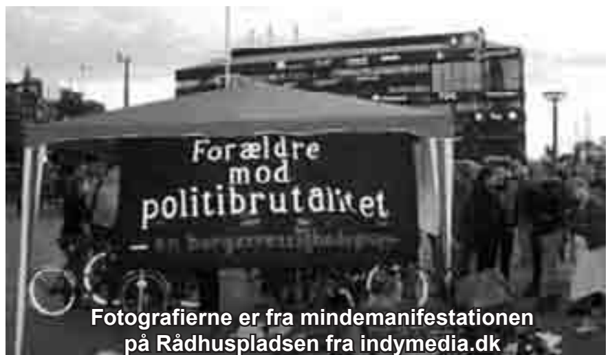
Fotografierne er fra mindemanifestationen på Rådhuspladsen