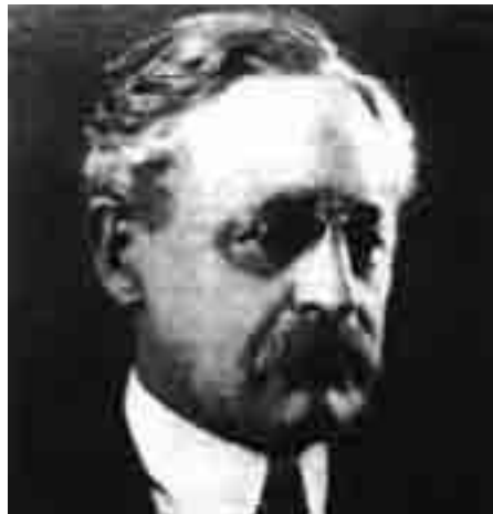
Geopolitikeren Sir Halford John Mackinder (1861-1947)

Eurasien er verdens superkontinentsakse. En magt, som dominerer Eurasien, vil udøve afgørende indflydelse over to af verdens tre mest økonomisk produktive regioner, Vesteuropa og Østasien. Et kig på et landkort lader også formode, at det land, som dominerer Eurasien, næsten pr. automatik vil kontrollere Mellemøsten og Afrika ...