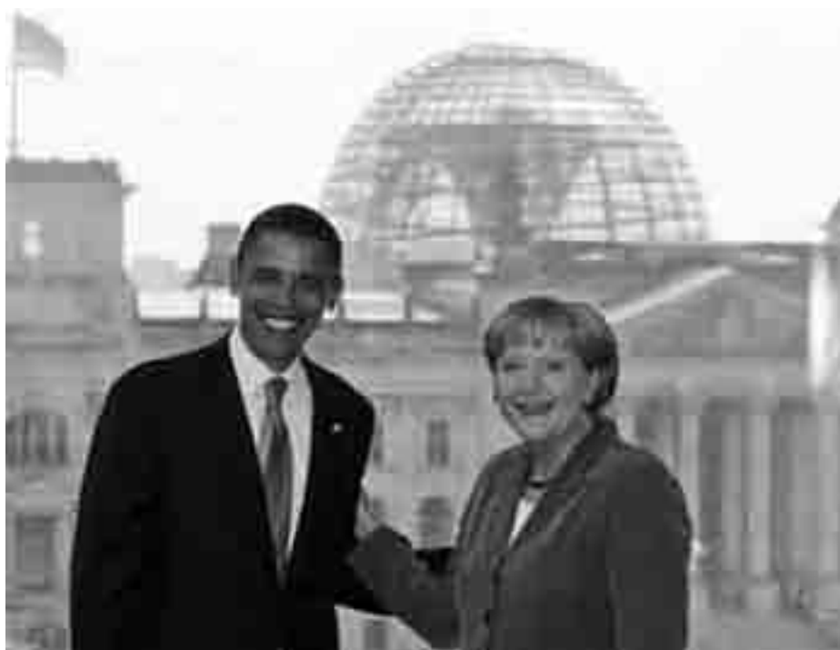
Obama med Merkel ved den tyske rigsdag

Vestmagterne arbejdede energisk på at slutte de tre vestlige besættelseszoner sammen og oprette en separat vesttysk stat – den stat, der blev West Germany eller Vesttyskland. I al hemmelighed forberedte og gennemførte vestmagterne en pengeombytning og 'valutareform'. Det var det afgørende brud, der tvang Sovjetunionen til af hensyn til befolkningen at træffe modforholdsregler. Indførelsen af den nye vesttyske mark skabte et ubeskriveligt kaos. I Berlin, hvor flere hundredtusinde arbejdere hver dag pendlede fra øst til vest, der var meget mindre ødelagt end øst, og hvor de fleste virksomheder var, kunne østtyskerne ikke længere komme tilbage til deres hjem i øst, hvis de ikke kunne betale sporvejs- eller metrobilletten i de nye vestmark.