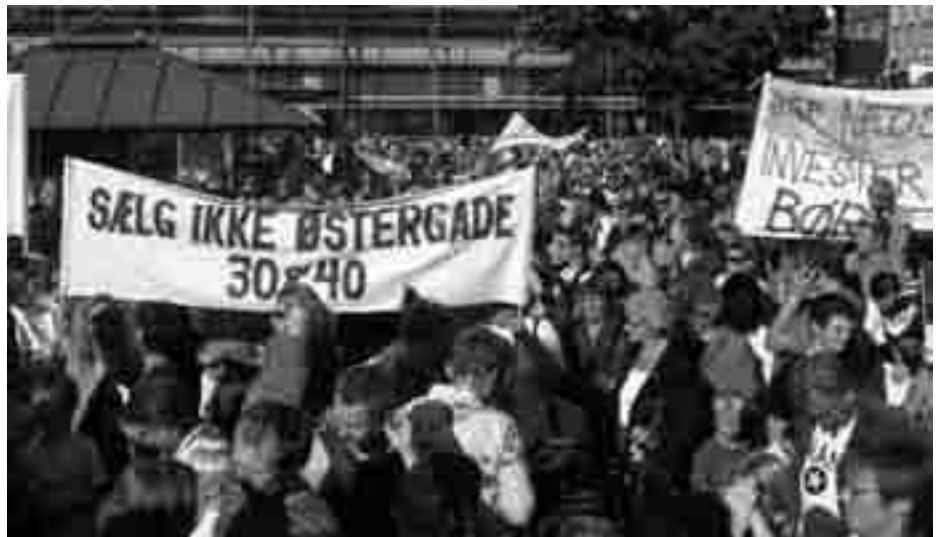
12. september 2006 var mere end 15.000 århusianere på gaden i protest mod kommunens nedskæringer. Nu skal der kæmpes igen.

Regeringens firkantede krav til gennemsnitskarakter uden medfølgende penge medfører, at skolerne bliver tungt til at nedprioritere de svageste elever. Problemet er, at pengene udeles efter antal elever, og derfor er små specialklasser, lejrskoler eller andre pædagogiske tiltag på vej til at blive skåret