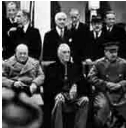
Churchill, Roosevelt og Stalin ved topmødet i Jalta – året før Churchill i antikommunismens navn blæste til uforsonlig kamp mod Sovjet

Han ville have opdaget, at blokaden og luftbroen var det måske største pro-