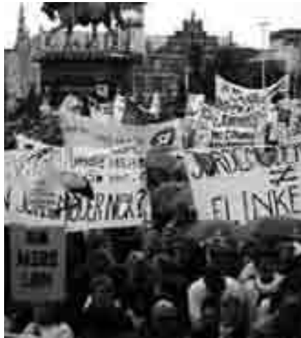
Christiansborg Slotsplads ved folketingets åbning i 2007 hvor 130.000 demonstrerede over hele landet

Den løgnagtige og bedrageriske Fogh-regering har fremlagt et nyt klassebudget til fordel for de rige med finanslovsforslaget for 2009. Samtidig bebudes nye angreb på dagpenge, aktiveringsordninger og efterløn. Det må bremses med masseaktioner, der får rejst og vist arbejderklassens vej ud af krisen