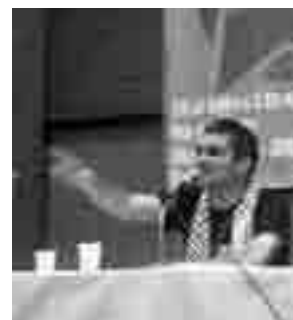
Latuff i panelet om Melle møsten på lejren

Den 39-årige brasilianer overdrog nogle omfattende serier af tegninger til DKU og Kommunistisk Politik til offentliggørelse i Danmark. En af dem er på forsiden af dette blad. Der planlægges udstillinger af dem i Oktober-bogbutikkerne.