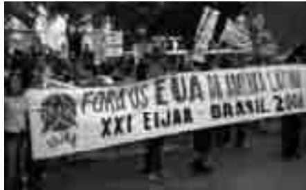
Lejrdeltagerne demonstrerer i Rio de Janeiro mod USAs imperialistiske politik i Latin Amerika

Den internationale ungdomslejr i Brasilien 2008 afsluttedes med vedtagelsen af følgende udtalelse, der opsummerer en række af lejrens emner og diskussioner. De internationale ungdomslejre afholdes hvert andet år på forskellige kontinenter. Den 22. lejr vil blive afholdt i Tyrkiet sommeren 2010