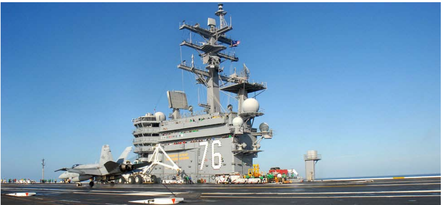
Billedet viser et af verdens største krigsskibe, Det amerikanske hangarskib USS Ronald Reagan på udflugt i Stillehavet i november 2007. I forgrunden ses et F18 Jagerfly under landing.

Problemet med CO2 er tilsyneladende enkelt, det handler om at skifte energikilde til noget der ikke forurener, så kan alle maskiner køre videre som om intet var hent. For kapitalismen er det bare ikke muligt, her er beslutningen op