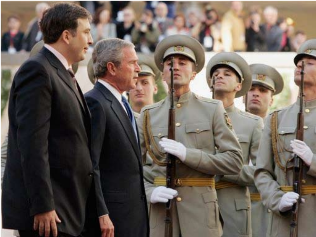
Præsident Bush inspicerer Georgiens hær sammen med hans protege Mikhail Saakashvili

omringning af Rusland gennem tidligere sovjetstater og østlande sammen med oprettelsen af det såkaldte missilforsvar fremskudt næsten til den russiske grænse.