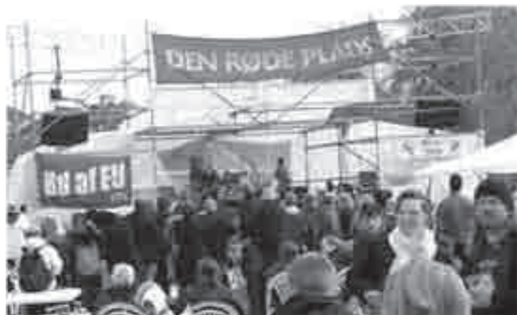
Sent på dagen blev det opholdsvejr i København ...