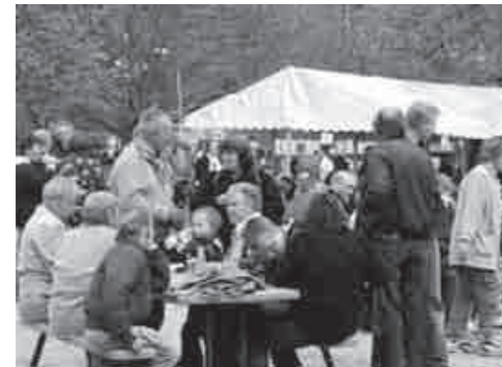
Rød 1. maj i Odense fandt undtagelsesvist sted i Kgs. Have og ikke i Munke Mose. Nogle tusinde fandt frem til det nye sted - men næste år er man tilbage i en renoveret Munke Mose