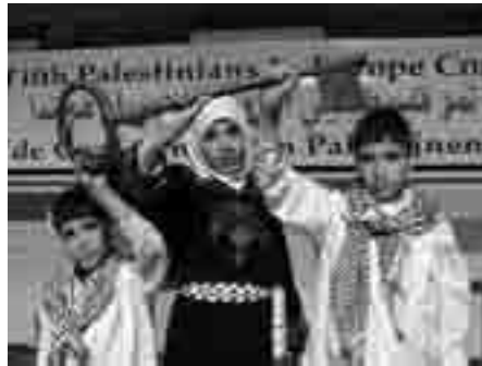
Palæstinensiske børn understreger retten til at vende tilbage

Den voldsomme immigration forårsagede spændinger mellem befolkningsgrupperne, og det blev til stadig-