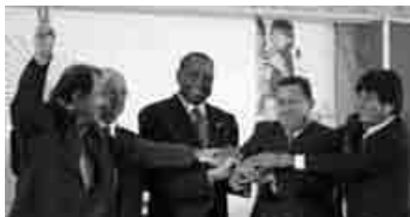
Alba-topmøde i Venezuela 2008

En tiårsplan er undervejs, som vil uddanne 200.000 læger i Cuba og på det nye venezuelanske medicinale universitet.