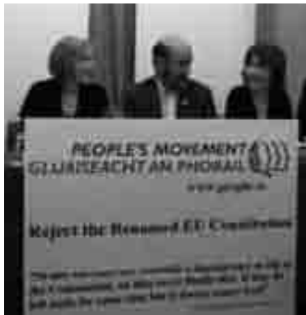
Irske unionsmodstandere mobiliserer for et Nej til Lissabontraktaten

Hver ny traktat gennem et halvt århundrede har båret i samme retning: Nye politiske områder er kommet ind under 'fællesskabet' og taget fra de enkelte medlemslande. Hver ny traktat viser også den retning, som kapitalisterne kigger i. Med