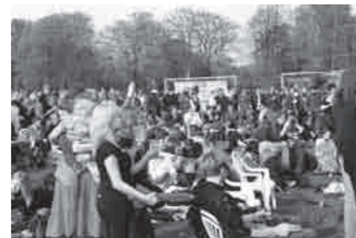
Efterhånden blev Den Røde Plads i Fælledparken fyldt godt op

og 1. maj-veteranerne Highway Child afsluttede arrangementet på Den Røde Plads, hvor solen brød frem sidst på eftermiddagen, og stemningen var så god, at det blev forlænget et par timer ud over den programfatsatte sluttid kl. 17.