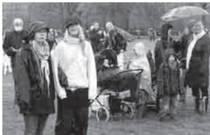
... men den startede vådt

Regnvejr og storkonflikten satte sit præg på årets 1. maj-arrangementer landet over, også på APK's og DKU's på Den Røde Plads i Fælledparken og Rød 1. maj i Kongens Have i Odense. Men solen vandt til sidst over regnen, de politiske budskaber trængte igennem, og en perlerække af musikere og bands var med til at banke stemningen i vejret.