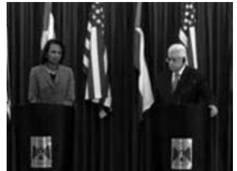
Abbas spiller USAs spil

Jeg spurgte i denne uge en højtrangerende PA-embedsmand i Ramallah, hvordan det vil komme til at gå for PA-ledelsen i Annapolis på baggrund af, at de langtrukne møder mellem israelske og palæstinensiske embedsmænd har været en klar fiasko.