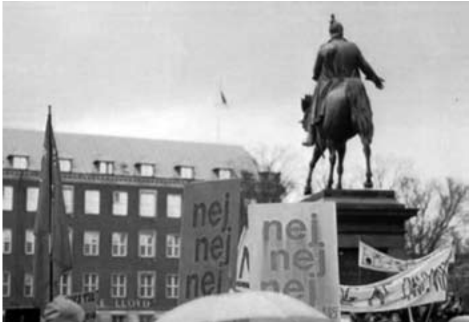
Demonstration op til folkeafstemningen i 1972

Dårligere skoler og uddannelsesinstitutioner, ringere social- og sundhedsvæsen, nedslidt infrastruktur – det er alt sammen konsekvenser af unionens neoliberal