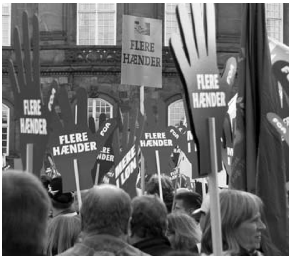
Hen ved 150.000 var på gaden den 2. oktober. Kravet om flere hænder og mere i løn var med i front.

SOSU-assistenternes kamp før sommerferien er stadig med til at påvirke dagsordenen i den faglige kamp for de offentligt ansatte. Man så det både i forhold til markeringen ved Folketingets åbning og ved forberedelsen af de kommende overenskomstforhandlinger for de offentligt ansatte.