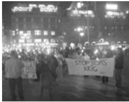
7. oktober 2001: Fakkeldemonstration på Rådhuspladsen i København i protest mod USAs angreb på Afghanistan

flere NATO-lande følge Danmarks eksempel.