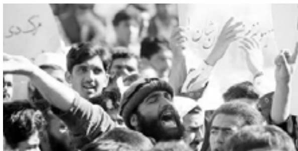
Antiamerikansk og anti-NATO demonstration i Kabul

Danmark og danske soldater har i seks år deltaget i krigen mod Afghanistan og besættelsen af landet.