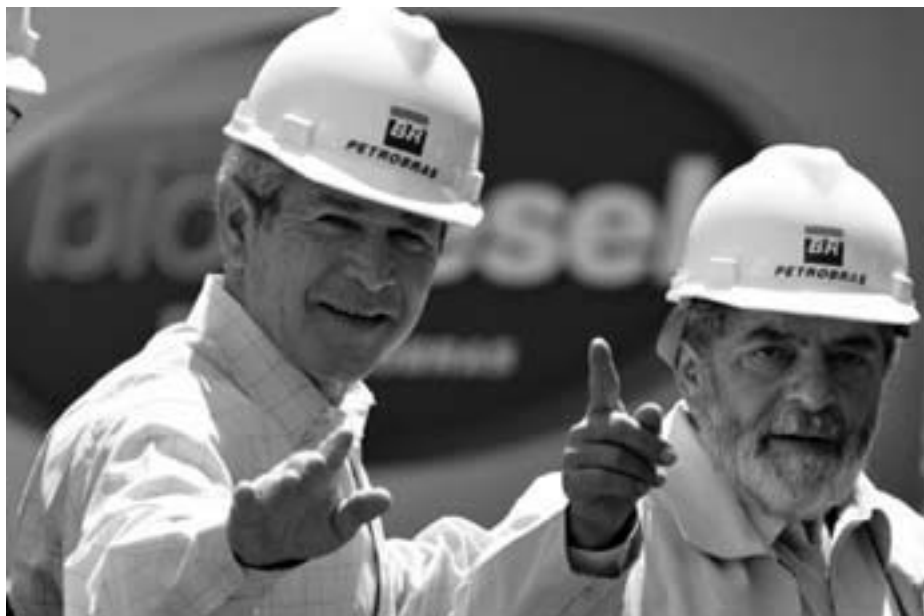
George Bush og Lula de Silva – kampfæller omkring monopolenes bio-fidus

Kernen i denne plan er en kæmpe-mæssig skattefinansieret udvidelse af brugen af bio-ethanol til transportbrændsel. Præsidentens plan forudsætter en produktion af 35 milliarder gallons ( ca. 133 milliarder liter ) ethanol om året i 2017. Allerede i 2005 vedtog kongressen loven om energipolitik, som går ud på, at kornbaseret ethanol til brændsel skal stige fra fire milliarder gallons i 2006 til 7,5 milliarder i 2012. For at sikre, at det sker, modtager bønder og gigantiske landbrugsvirksomheder som ADM eller David Rockefeller generøse skattefinansierede støtteordninger for at dyrke brændselkorn i stedet for fødevarer. Lige nu får producenter af ethanol i USA et tilskud på 51 cents pr. gallon ethanol udbetalt til den, der blander det, normalt et oliefirma, som blander det i benzin til salg.