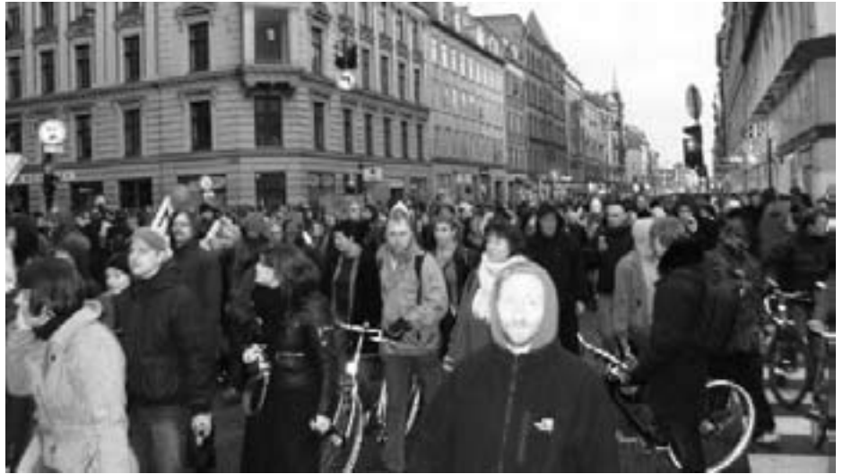
Demonstrationen fra Blågårds Plads på vej op ad Nørrebrogade mod Jagtvej i protest mod rydningen af Ungdomshuset samme morgen, taget d. 1. marts 2007 klokken godt 17, ganske kort før politiet med en velforberejdet knibtangsmanøvre gik til angreb.

Det bliver særlig grotesk ved, at det er bevist, at langt de fleste demonstrationsdeltager ikke har kunnet høre, at politiet erklærede demonstrationen for opløst, og at de ganske enkelt ikke kunne komme væk, da politiet med en borgerkrigs-lignende knibtangsmanøvre delte demonstrationen op og spærrede en del af den inde på Nørrebrogade ved muren til Assistents Kirkegård.