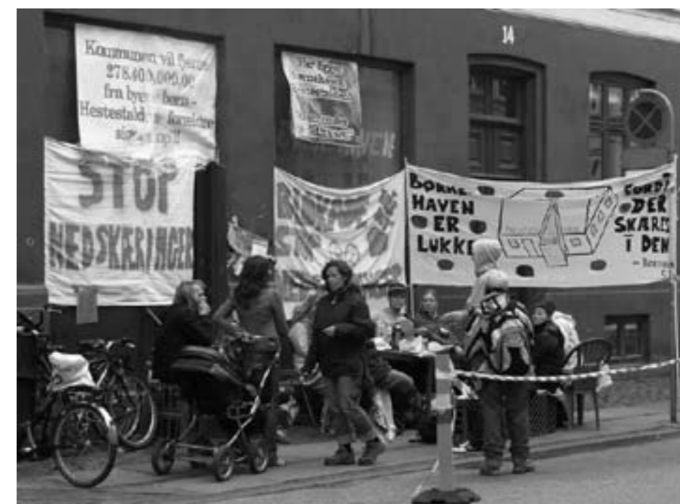
Tusinder af forældre var med til at protestere. Da pædagogerne for alvor ville kaste sig ind i kampen, trak politikerne i land og opgav mange af besparelserne på børne- og ungdomsområdet