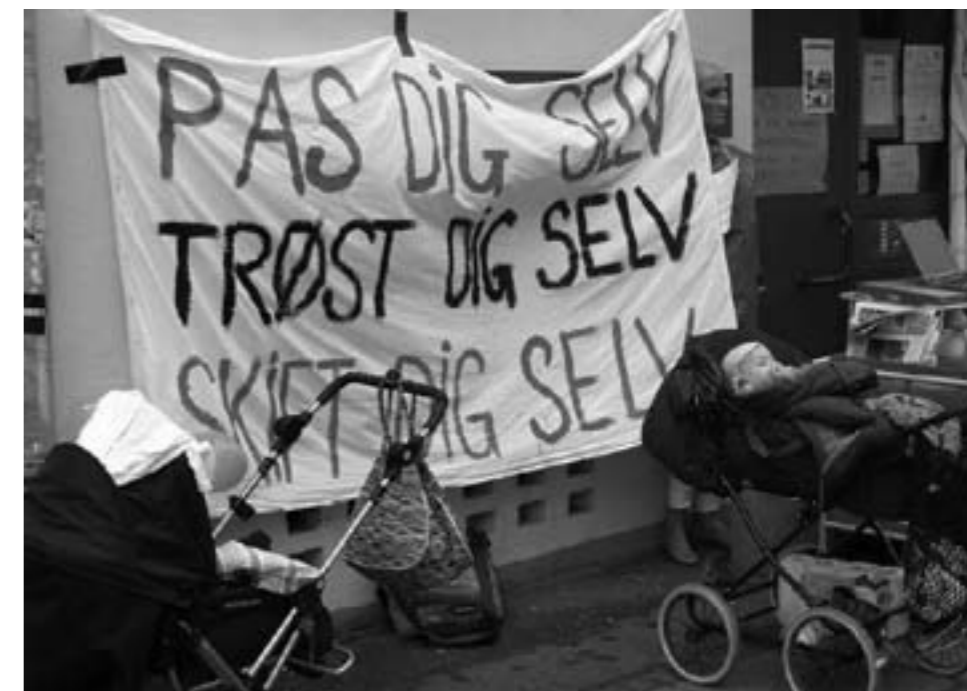
Pas dig selv – Trøst dig selv – Skift dig selv

Der må være nogen, der på et tidspunkt siger stop og ikke bare glædes over, at de stagnerede skatter giver råd til flere røde bøffer eller en opgradering af mellemklassebilen. Det handler om noget så gammeldags som solidaritet og socialt ansvar.