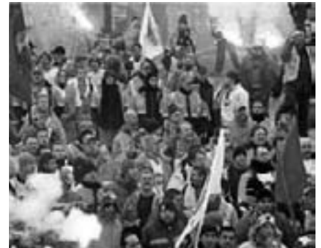
Fra protesterne mod EUs havnedirektiv, 2006

tjener i forvejen mange hundredtusinder kroner over og langt væk fra en gennemsnitlig 3F'ers løn. Men det har altid været et sprængfarligt område at komme ind på, fordi de oftest socialdemokratiske pampertoppe har vogtet nidkært over benene.