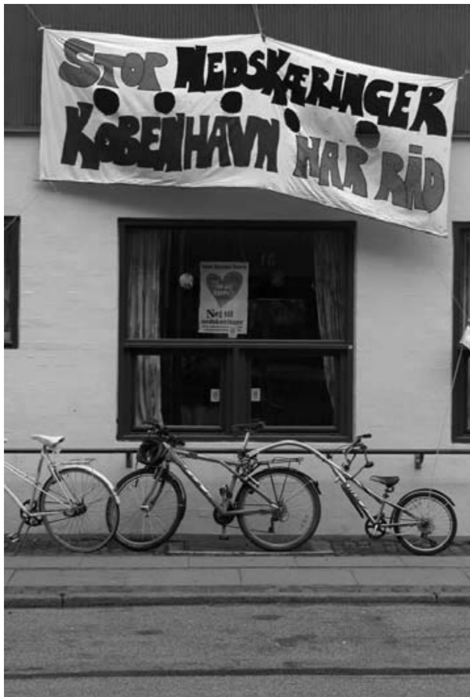
Fotos fra forskellige blokaderamte daginstitutioner fredag den 21. september 2007. HG – Kommunistisk Politik

Billedreportage fra kampen mod Københavns reaktionære nedskæringsbudget