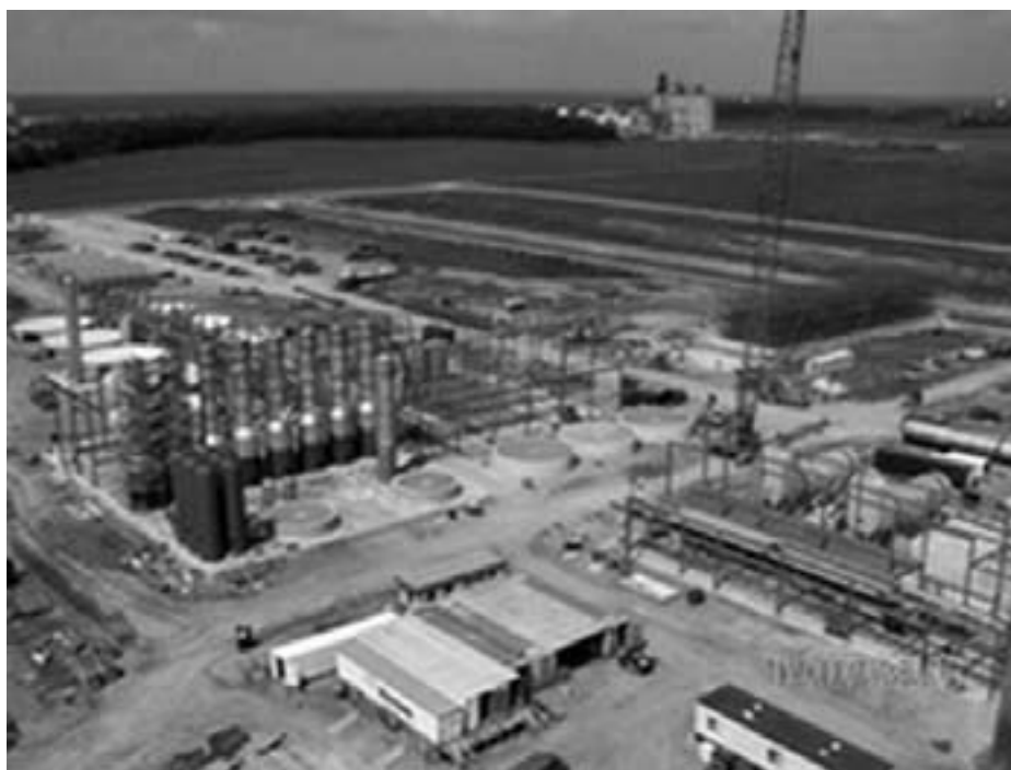
Bio-ethanol anlæg i Clymers, Indiana, USA.

er desperate efter højere indkomster efter år med kornpriser i bund, går bort fra den traditionelle afgrøderotation for udelukkende at dyrke sojabønner eller korn, hvilket resulterer i en voldsom jorderosion og skaber behov for tilsætning af kemiske pesticider. I USA bruges allerede nu 40 pct. af alle ukrudtsmidler i korn. Monsanto og andre producenter af giftige ukrudtsmidler som Roundup stormiler på vej til banken.