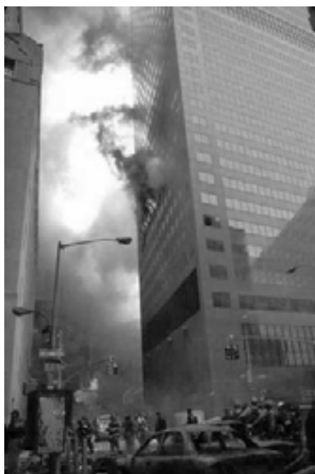
Bygning 7 - ikke ramt af fly

Disse udladninger udgør et klart og direkte bevis for eksplosioner, som det fremgår af simpel matematisk beregning. Data taget fra et fotografi fra KTLA Kanal 5-Nyheder viser klart en strømmende linje af udskydende materiale, der ligner flere af de andre udladninger, som blev filmet denne dag. Denne strøm består for størstedelens