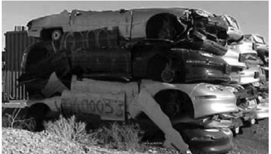
I halvtredserne opkøbte General Motors det kollektive sporvognssystem og skrotede det. I 2003 fik man stoppet den batteridrevne elbil og knuste alle bilerne.

I 1987 vandt General Motors et væddeløb for soldrevne biler i Australien og valgte at lade det unge team af ingeniører prøve kræfter med at bygge en eldrevet bil til almindeligt brug. Det lykkedes over al forventning. I midten af 90'erne præsenterede de EV1, en lille 2-personers batteridrevet el-bil, der kunne følge med trafikken på motorvejen op til 130 km/t med en rækkevidde på ca. 160 km, og en batterilevetid på 240.000 km med NiMH batteriteknologi. Denne type køretøj opfylder behovet hos 80-90 procent af personbiltrafikanterne. Den larmer ikke, man slipper for benzinstationen, fordi den kan oplades derhjemme om natten, og der skal