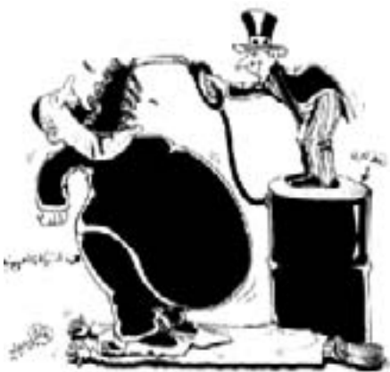
"USA giver zionisterne gratis irakisk olie" Avisen Al-Watan, 24. marts 2004.

Totalt fortiet: Israels rolle i den kriminelle besættelse af Irak.