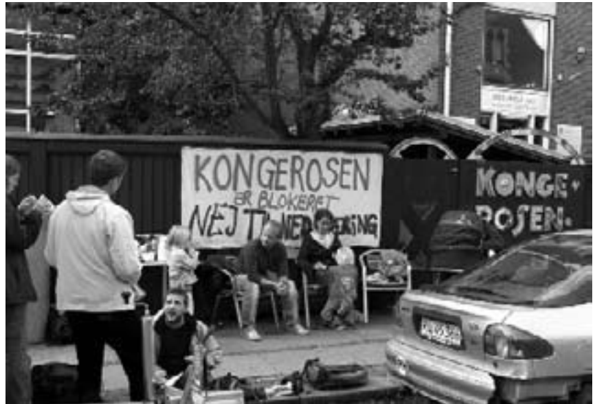
Forældreblokade af børnehaven Kongerøsen, Vesterbro 2006

De første demonstrationer i forbindelse med budgetforhandlingerne på Rådhuset har allerede været afholdt, og de vil fortsætte op til en vedtagelse – og evt. efter, hvis ikke nedskæringerne tages af bordet.