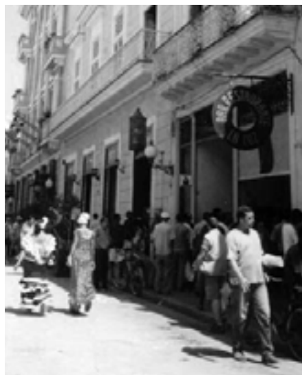
Gade i Havanna

De undervurderer Revolutionens allerstørste fremskridt, dens resultater i uddannelsen, den massive opdyrkning af folks talenter. De fastholder at nogen må leve ved at udføre simpelt og barskt arbejde. De undervurderer resultaterne og overdriver omkostningerne ved videnskabelige investeringer. Og værre endnu overser de værdien af de sundhedsydelser, som Cuba forsyner verden med. For beskedne midler blotlægger Revolutionen det system, imperialismen har påtvunget, og som mangler det men-