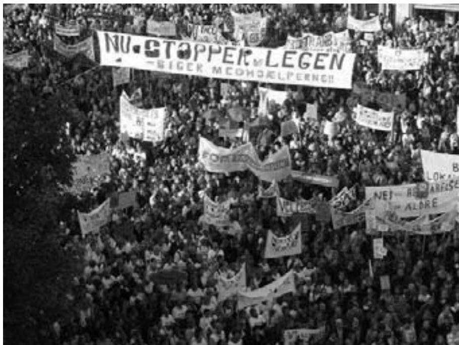
Fra protesterne i Århus den 3. oktober sidste år

Der kommer store demonstrationer over hele landet, når folketinget åbner tirsdag den 2. oktober. De uddannelsessøgendes organisationer går med