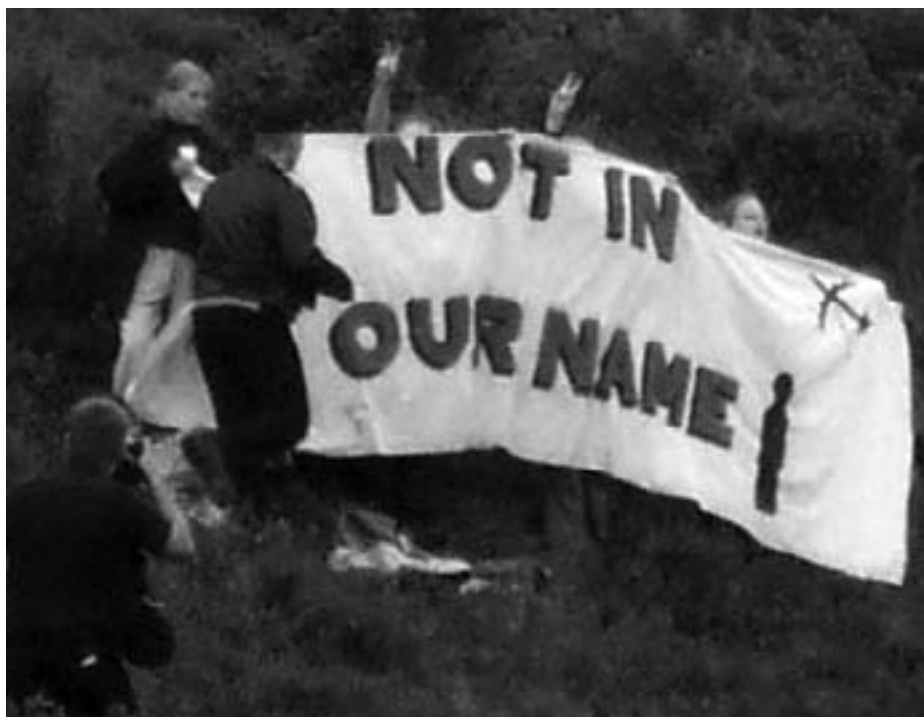
Politi mod Rebild-aktivister

mindst med fokus på den officielle forklaring på angrebet på World Trade Center tårnene 11. september 2001.