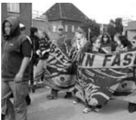
Antifascistisk protest i Horsens, lørdag den 18. august

Det politiet mest var optaget af var, om der skulle komme grupper af synlige modstandere i sort beklædning ind på pladsen.