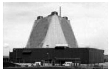
Thule-radaren: Stjernekrig og militarisering af Arktis

Netavisen Kommunistisk Politik på nettet - hver dag www.kpnet.dk