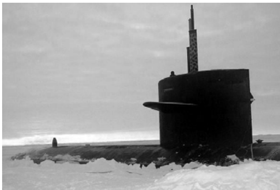
Ubåd på Nordpolen – militariseringen af Arktis en kendsgerning

Ottawas beslutning fra juli 2007 om at etablere en militær station i Resolute Bay i Nordvestpassagen havde ikke til formål at understrege canadisk overherredømme. Faktisk var det lige det modsatte. Den blev etableret efter rådgivning fra Washington. En dybvandshavn i Nanisivik på den nordligste spids af