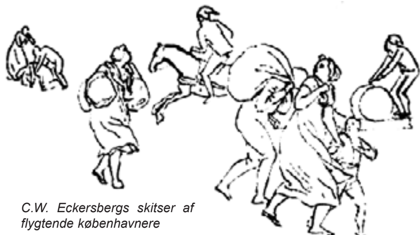
C.W. Eckersbergs skitser af flygtende københavnere

Igennem alle de nævnte krige har Danmark eller dele af landet været besat af svenskere, englændere og tyskere. Udfaldet er bestemt af de europæiske alliancer, og fredsbetingelserne har i regelen været dikteret af de til enhver tid mægtigste magter. Det har ført til en strategisk opportuniste hos de herskende, som altid søger at alliere sig mod 'den stærkeste', den formodede 'vinder' - og som har fravalgt en reel selvstændig neutralitets- og udenrigspolitik.