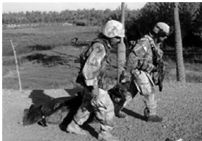
Amerikanske soldater med liget af irakisk lejesoldat

Det er en skam, at de danske politikere ofrede danske soldater for en påstået demokratisering af Irak, mens de i dag beskytter irakiske besættelsestolke. Hvis disse tolke virkelig troede, at de ved deres tjeneste hos den danske besættelsesmagt bidrog til demokratisering af Irak, så må de bliver dér og føre kampen for demokratiseringen videre, efter at besættelsesmagterne begynder at