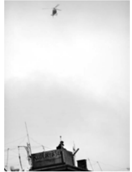
Politistormen 1. marts

To musikere, der havde overnattet der, fordi de havde givet koncert på Ung-