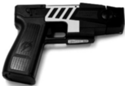
Taser: El-pistol der kan dræbe