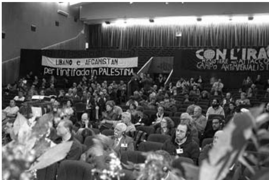
Konferencesalen i Chianciano Terme

Nogle læsere vil måske forbavses over at høre dette, for Chianciano-konferencen blev i virkeligheden totalt forbigået af massemedierne. Og man ved, hvad dette betyder i vores mediasamfund. Når denne begivenhed af global interesse skjules fuldstændigt, er det imid-