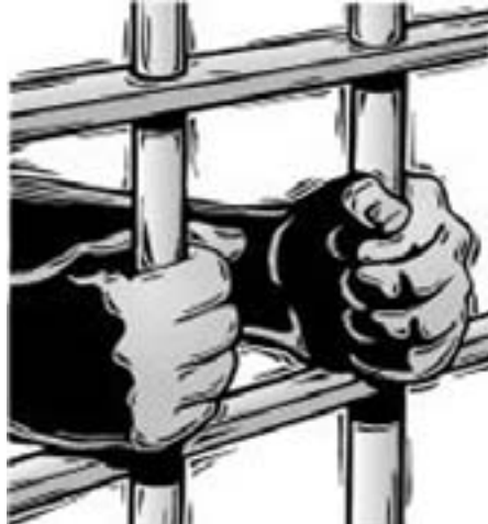
Mange er fortsat varetægtsfængslede uden dom for protesterne mod ødelæggelsen af Jagtvej 69