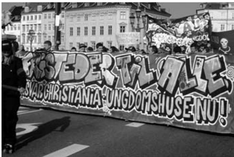
FORSVAR CHRISTIANIA! UNGDOMSHUSE NU! 10.000 deltog i demoen den 30. marts

Ved morgenurineringen er det en ung betjent, som følger mig. Han ligner en fløs på 17 år. Jeg overvejer, om han er i praktik, men så havde han vel næppe fået lov at følge mig alene. Meget sød fyr – stakkels knægt, der har truffet et forkert valg. Arbejdsdagen giver stort set kun negative indtryk. Hvilke men-