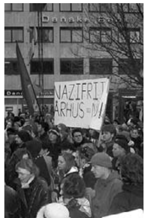
Fra protesterne mod overfaldet i Café Oskar