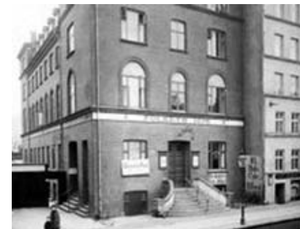
Jagtvej 69 for ca. 100 år siden

Allerede i 1911 blev den internationale kvindedag gennemført i Danmark, Tyskland, Østrig og andre lande og i de følgende år på skiftende søndage i marts. I 1921 besluttede Kommunistisk Internationales 2. kongres at gøre 8. marts til