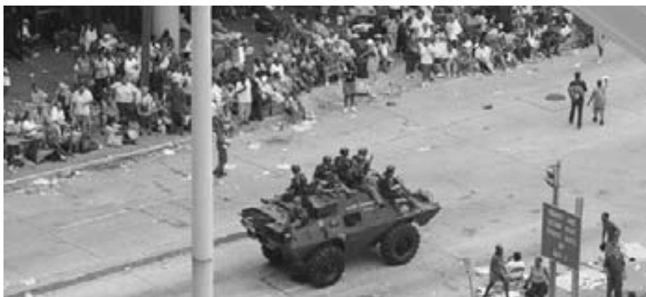
New Orleans efter orkan Katrina

Oktober - Århus Ny Munkegade 88 kld. 8000 Århus C Åbningstid: fre 14 - 17.00