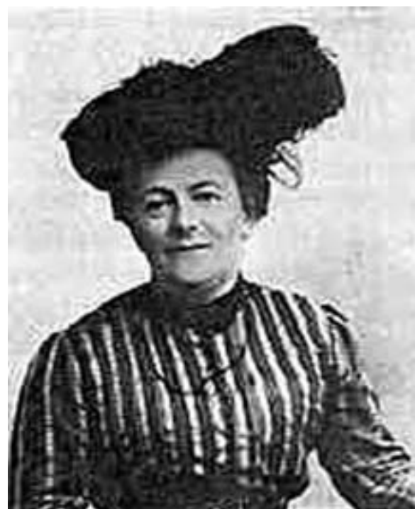
Clara Zetkin (1857 - 1933), fremtrædende marxistisk kvindeforkæmper. Uddannet lærer. Sluttede sig som ung til det revolutionære tyske socialdemokrati, leder af det socialistiske kvindearbejde. Var den første kommunist i den tyske Rigsdag.

og vil blive åbnet kl. 9 om formiddagen den 26. august.”