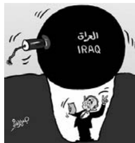
God imperialismen? Bush fabler stadig om sejr i Irak