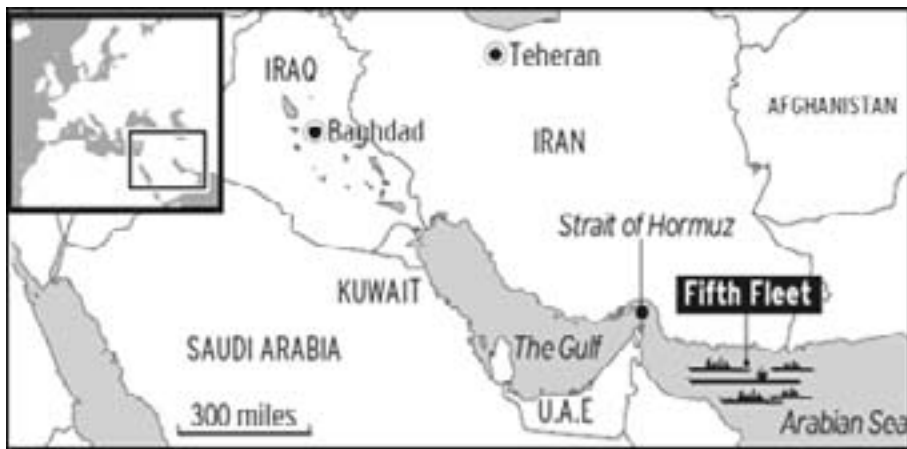
Krigsforberedelser mod Iran: Den femte amerikanske flåde i den Persiske Golf

vet så mange formodninger og fordrejninger i alskens medier om, hvor det næste slag skal slås. Meget tyder jo på Iran, men hvem vil skyde først, og meget vigtigt, hvem vil komme Iran til undsætning? Vil der blive brugt små, taktiske atomvåben?