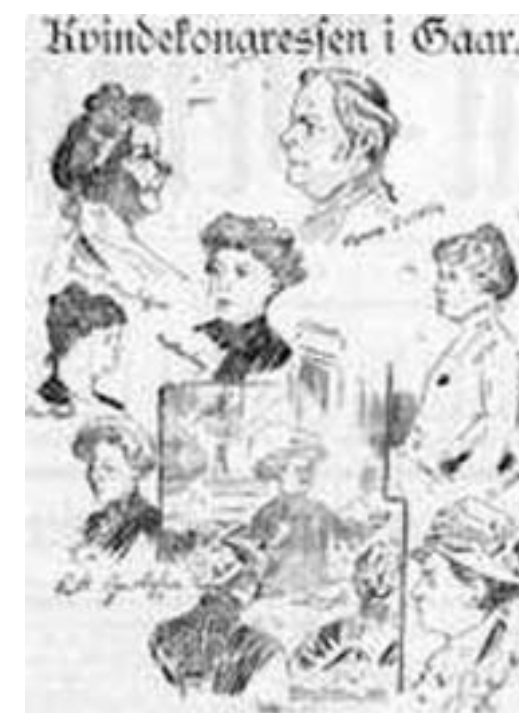
Bladtegning fra konferencen: Clara Zetkin øverst th

Det er ufatteligt, at bygningen ikke anses for bevaringsværdig. Alene dens historiske rolle i den internationale kvindekamp gør, at Jagtvej 69 bør bevares for eftertiden.