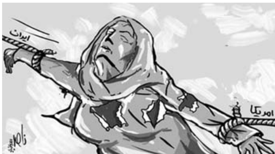
Irak - mellem USA og Iran

"I dag står den vestlige verden i en krig for sine værdier – eller sin kultur, om man vil." Danmark og resten af den vestlige verden står over for tabet af "den enestående påstand, at alle mennesker er skabt lige med visse ufortæbelige rettigheder. Og at vi skal forsvare dette livssyn over for formørkede eksis-