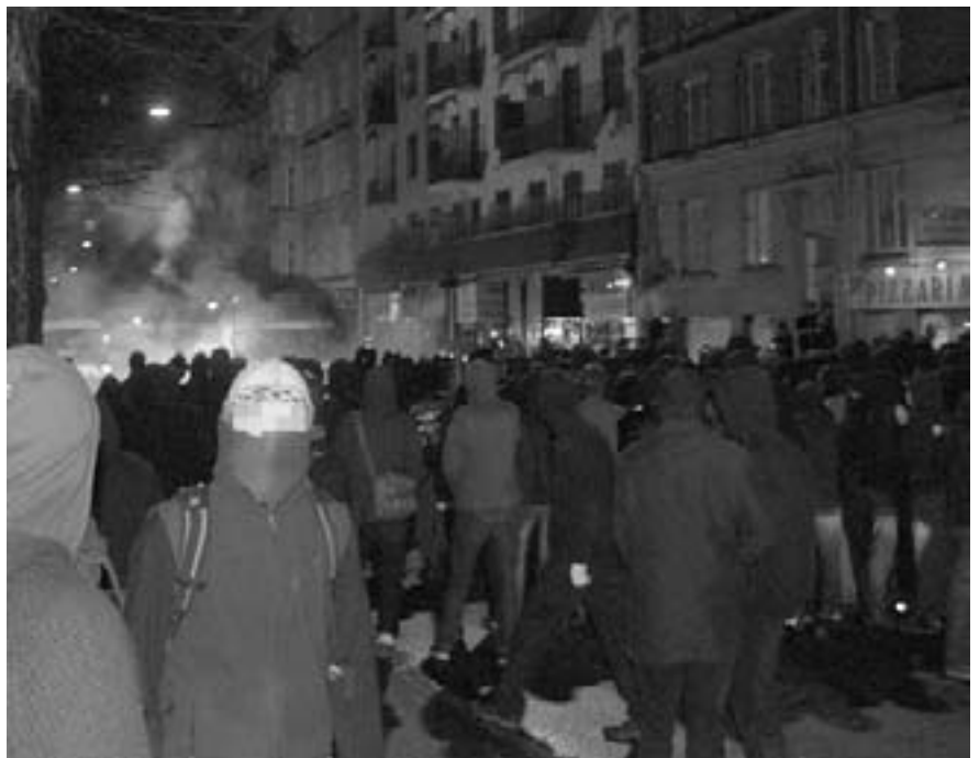
Politiets provokationer og masseanholdelser blev bl.a. mødt med barrikader og bål - her på Nørrebrogade

Det er ikke overraskende, at journalisterne mod bedrevidende agerer som