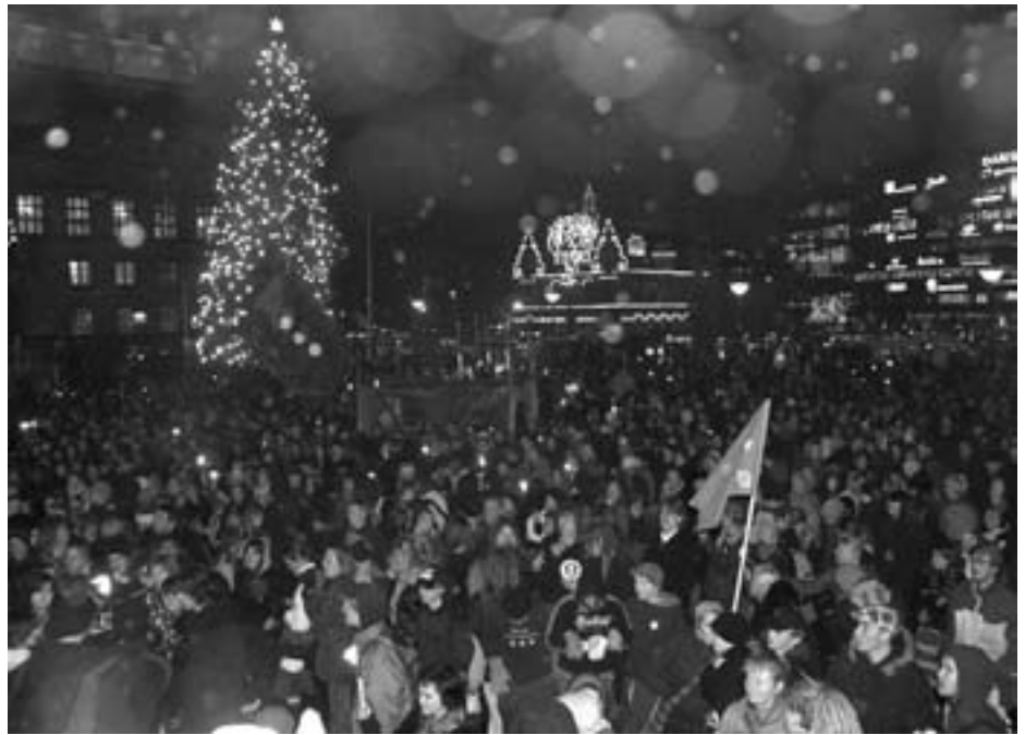
Mere end 5000 til 'Ungeren Blir' demo, Rådhuspladsen 14. december

Endnu mere grotesk bliver det, at Ritt Bjerregaard fuldstændig løber fra den aftale med de unge, som hendes forgænger som overborgmester Jens Kramer Mikkelsen underskrev i 1982, hvor kommunen garanterede et ungdomshus.