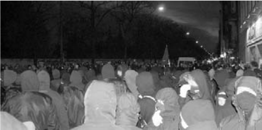
Fra starten ved Ungdomshuset

let lytte til os. I seks år har de fastholdt, at problematikken omkring Ungdomshuset har skullet løses af politiet.