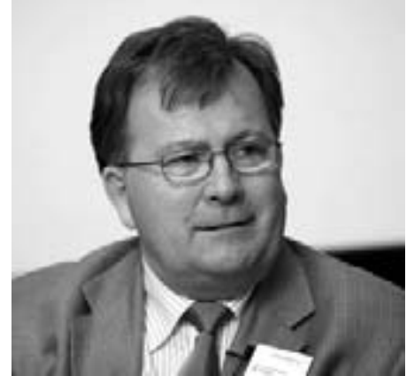
En mand på vej til førtidspension

Trods massiv politiker og medielarm om at folk skal blive længere på arbejdsmarkedet, vil de fleste på pension som 60- eller 62-årige. Regeringen gennemfører en politik stik imod flertallets ønsker.