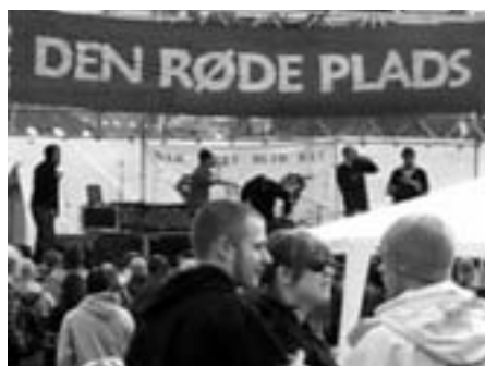
1. maj 2006 i Fælledparken

Kampvilje og kampevne er i øjeblikket det eneste, der forhindrer Fogh-regeringen at gennemføre en endnu voldsommere ødelæggelse af den offentlige sektor – i retning af den 'minimalstat', man offentligt afskriver, men fortsat