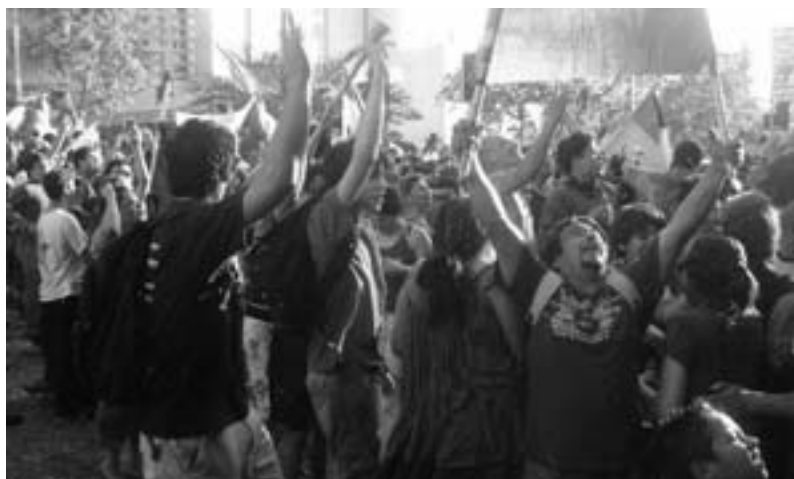
Santiago: Jubel ved den amerikanskstøttede diktators død

Den værste af alle chilenske fascister døde i går, denne forbryder, tyv og lakaj for de multinationale selskaber og for imperialismens internationale hovedstad. Denne professionelle fjende af nationen, folket og arbejderne er udåndet i sin egen stank. Fra alle kanter af landet, blandt folk i hele verden, eksploderer folk i glæde, tusinder jubler i gaderne og endnu flere i deres hjem, og politiets forsøg på at undertrykke glæden kan ikke mørklægge vore kæmpende og glade ansigter. Pinochets død inspirerer os til at tilintetgøre hele hans reaktionære arv og tjenester for imperialismen.