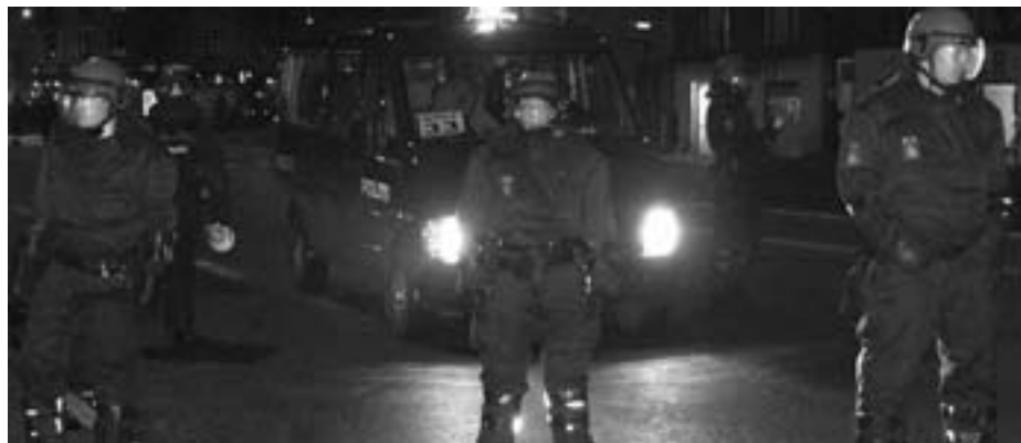
“Anhold i flæng!” - kampklædt politi stoppede Ungeren demoen den 16. december fra Jagtvej til Christiania næsten før den gik i gang

Forventer de, at vi nu skal spille badminton i stedet?