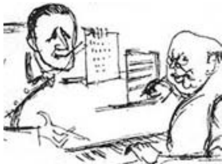
Brecht og Hans Eisler

Men det var ikke altid, de danske oversættelser passede til musikken. Så en stor del af mit arbejde handlede også om at få tekst og musik til at passe sammen. Et pillearbejde af de helt store, og heller ikke det var lige velanset. Men for mig var det vigtigt, at sangene kunne synges