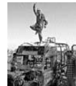
Irakisk dans på US militærkøretøjer

foran tv inden lagen tid, søvnløs prikkende angst skygger på væggen blå blink udenfor lytten efter skridt på trappen F-16 maskiner, der kaster bomber, et sted i Afghanistan.