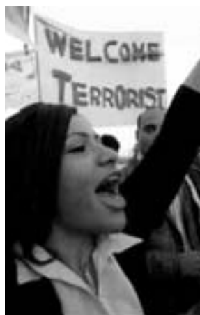
Bush i Amman