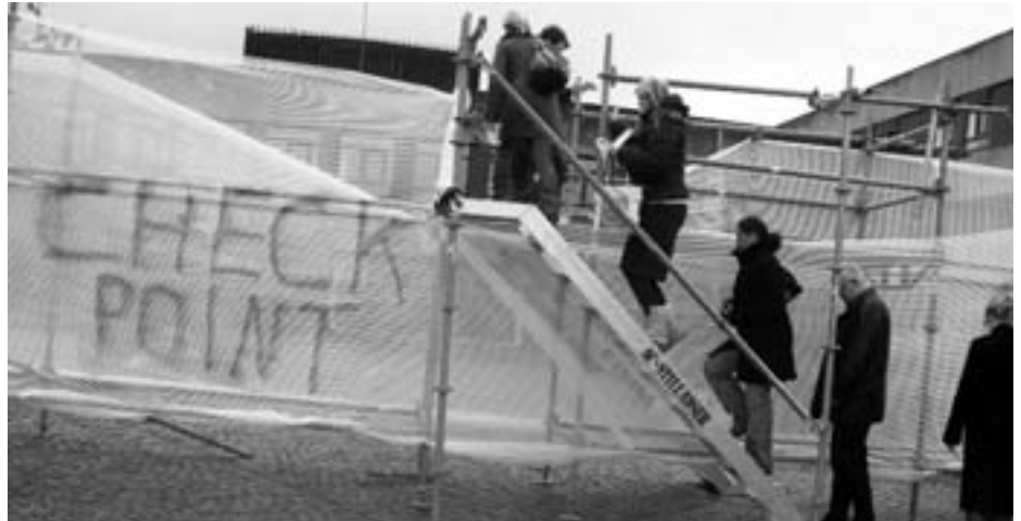
Checkpoint ved RUC

Som led i den internationale solidaritetsuge mod Israels apartheidmur i Palæstina opstillede Riv Muren Ned-initiativet checkpoints forskellige steder i København og andre steder i landet – bl.a. på Strøget i København, på Københavns Universitet Amager og på RUC.