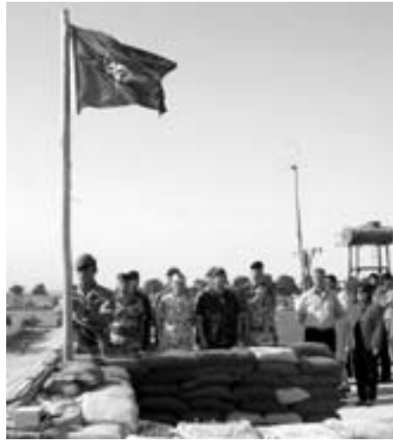
NATO hejser flaget i Afghanistan

Overhalingen, amputeringen og rekonstruktionen af Mellemøstens nationalstater markedsføres som en løsning på fjendtlighederne i Mellemøsten, men