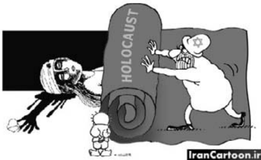
Karikaturkonkurrence: Abolfazl Motarami, Iran