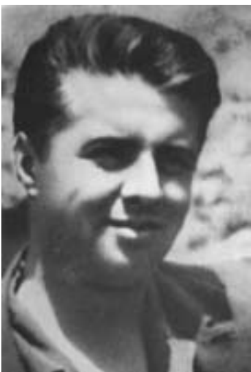
Enver Hoxha under den nationale befrielseskrig

Hun er stadig bosat i Tirana og følger med i udviklingen af den albanske og internationale kommunistiske bevægelse.