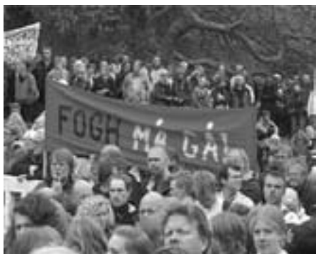
Fra 17. maj protesterne, Århus: FOGH MÅ GÅ!

testen, er der tale om voldsomme forringelser.