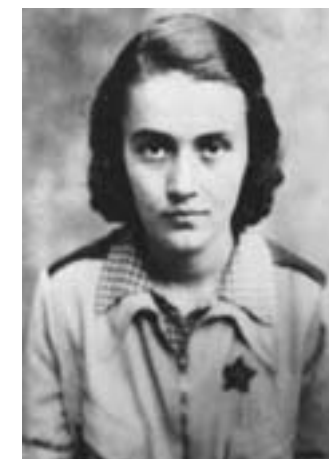
Nexhmije Xhuglini under befrielseskrigen

Jeg udtrykker også min taknemmelighed over for forlaget, som har påtaget sig at lade mine samlede memoarer se dagens lys.