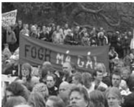
Fra 17. maj protesterne, Århus: FOGH MÅ GÅ!

testen, er der tale om voldsomme forringelser.