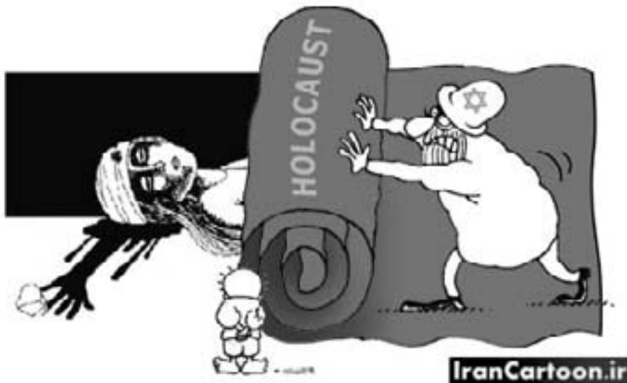
Karikaturkonkurrence: Abolfazl Motarami, Iran