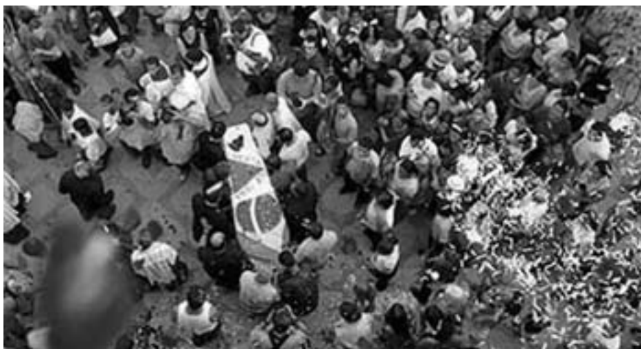
Familie og venner bærer brasilianeren Jean Charles de Menezes' kiste til graven 29. juli 2005. Han blev myrdet af britisk politi.

Den 2. juni blev der vedtaget ændringer til straffeloven. Et led i de stadige stramminger i den såkaldte kamp mod terror.