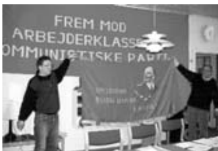
'Frem mod arbejderklassens kommunistiske parti' Fra APKs stiftende kongres. Partiet er nu på vej mod den 3.

- For os at se er det det samme, der sker, når terrorlovene tages i brug politisk, og når Fogh og Co. søger at lukke og straffe Ungeren, Christiania og Tvind. Det er led i samme reaktionære bølge: krig udadtil, klassekrig indadtil. Alt, hvad der minder om et alternativ eller bare antyder, at et andet samfund end Foghs, Bushs og EU's nyliberale model er mulig, skal knuses. Retsvæsenet bruges til det. Sådan er det i et kelasamfund som det danske.