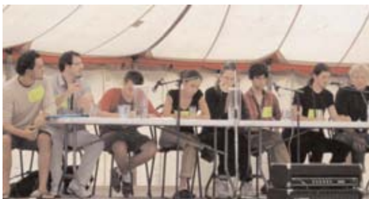
Franske unge fortæller i det store telt om deres succesrige kamp for at vælte arbejdsmarkedsreformen CPE