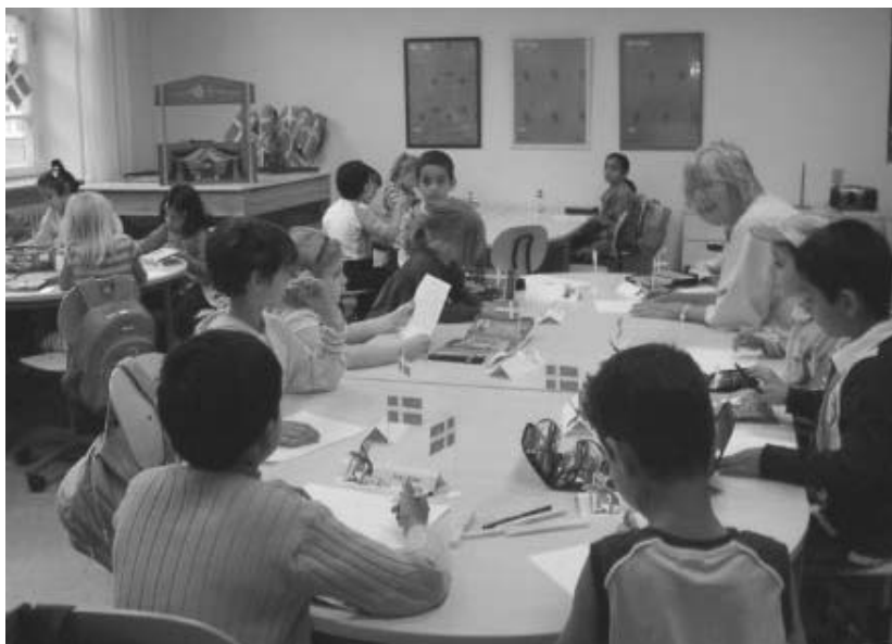
Første skoledag: En af de børnehaveklasser på Vesterbro Ny Skole

Danmarks pt. mest omtalte skole er nok Vesterbro Ny Skole. Det gav storm i medierne, da skolen kort før ferien angiveligt efter pres fra danske forældre besluttede at inddele deres børnehaveklasser efter etnicitet. Kritikken haglede ned mange steder fra.