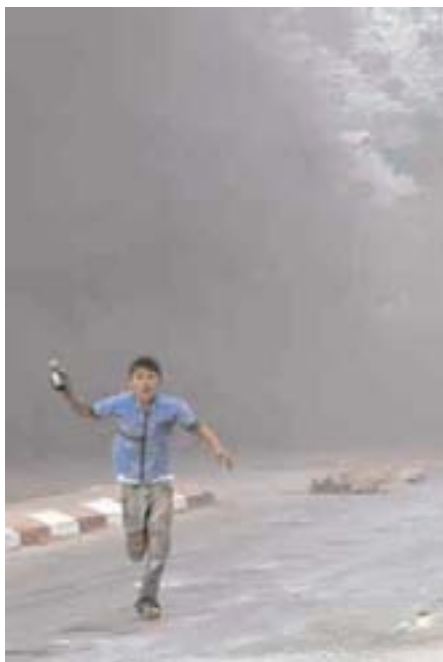
Dreng kaster med sten mod israelske besættere i landsby nær Jenin 11. august

Det er den "demografiske trussel", ikke sikkerheden (har hr. Olmert forklaret)