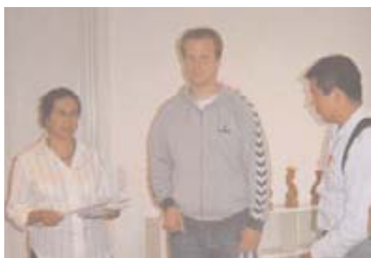
Delegation fra DKU og International Ungdomslejr overrækker protest til repræsentant for den mexicanske ambassade (tv)

En mexicansk kammerat, som havde deltaget på International Ungdomslejr, var også med ved protesten på ambassaden. Ud fra egne erfaringer kunne han fortælle ambassaderepræsentanten om, hvilken undertrykkelse og vold de oplever i Oaxaca-regionen.