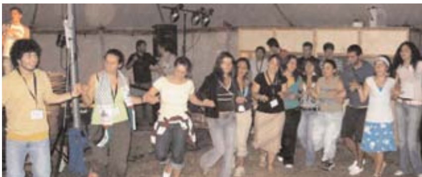
Organiseret Riminalitet (tv) - et af de mange danske bands der støttede og optrådte på lejren, hvor delegationerne også deltog med indslag, på billedet (th) er der tyrkisk kædedans.