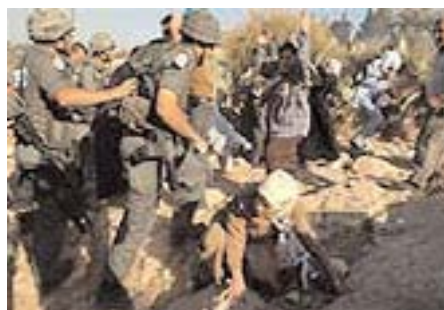
Budrus: Nye israelske overgreb