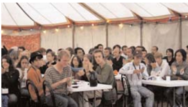
Det store telt kunne rumme 300 siddende tilhørere