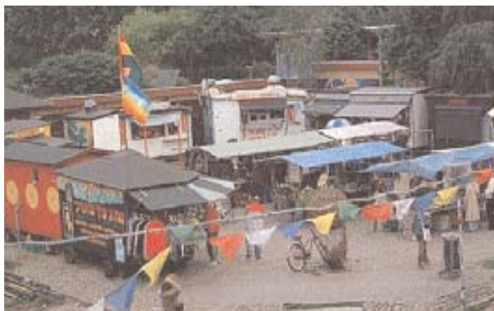
Sidste sommer første politiet krig mod Cirkus Christiania, og stadig er det hverdag at kvinder og børn gamle og unge bankes af ordensmagten

På mailen lå bl.a. historien her fra Støttekredsen for flygtninge i fare: