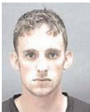
Steven Green, amerikansk soldat, der voldtog og myrdede den 14-årige irakiske pige Abir i Mahmudiya.