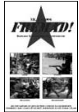
FREMAD nr. 2, 2006

Dengang – som nu – udtrykte klassekampen sig i arbejdspladsstrejker, som blev kaldt 'ulovlige', både her og der, bl.a. typograferne i det Berlingske hus og den store Philips-strejke (radio). Overalt var unggommunisterne på stik-