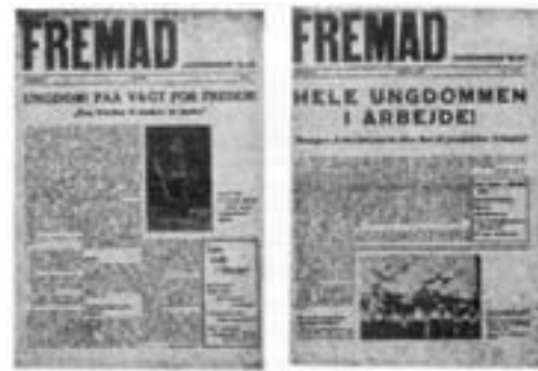
DKUs blad FREMAD i 30'erne

komme ind i frokoststuen til de højere uddannede proletarer, lød det forbitret: