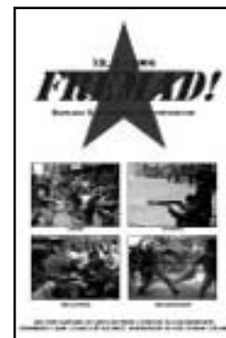
FREMAD nr. 2, 2006

Dengang – som nu – udtrykte klassekampen sig i arbejdspladsstrejker, som blev kaldt 'ulovlige', både her og der, bl.a. typograferne i det Berlingske hus og den store Philips-strejke (radio). Overalt var unggommunisterne på stik-