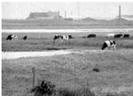
Cheminova idyl: Fra 1953-62 dumpedes 1300 ton kemisk affald på Harboøre Tange

Den kemiske industri – herunder bl.a. farve-, lak- og grafisk industri, plantebeskyttelse, fødevarsminkning, parfumeindustri samt medicinalindustrien og store dele af våbenindustrien – har, i hvert fald siden de rabiate forsøg i kon-