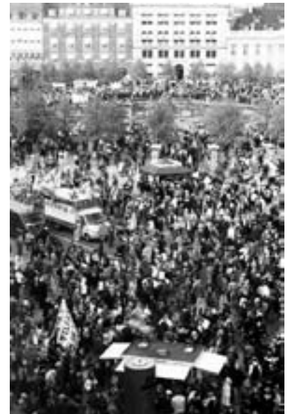
17. maj, Kgs. Nytorv

Efterlønsordningen vil fremover også være betinget af, at man har 30 års a-kasseanciennitet (modsat tidligere 25 år), hvorfor mange allerede her har mistet retten, idet de måske først har knyttet sig til ordningen som 35-årig.