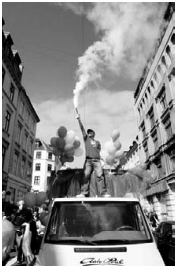
Stop det globale nyliberale felttog!

I år byder den danske sommer på en enestående mulighed for at mødes på tværs af grænser og