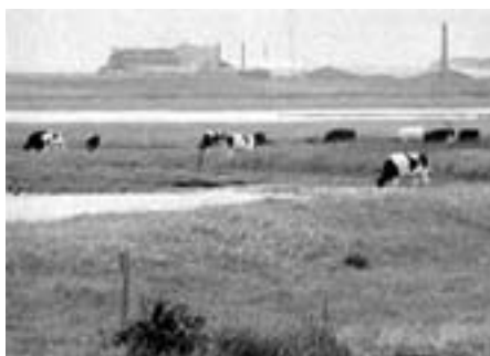
Cheminova idyl: Fra 1953-62 dumpedes 1300 ton kemisk affald på Harboøre Tange

Den kemiske industri – herunder bl.a. farve-, lak- og grafisk industri, plantebeskyttelse, fødevarsminkning, parfumeindustri samt medicinalindustrien og store dele af våbenindustrien – har, i hvert fald siden de rabiate forsøg i kon-