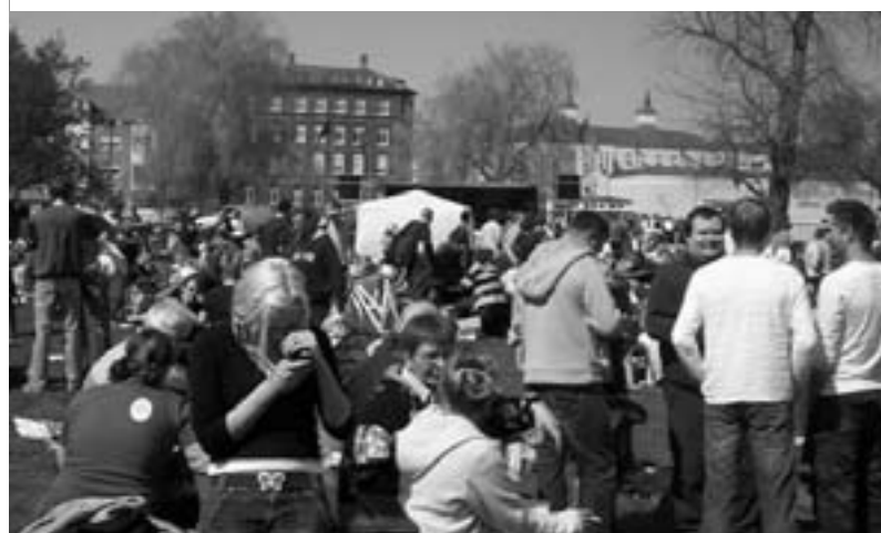
Rød 1. maj Munke Mose Odense: 6-8000 deltagere