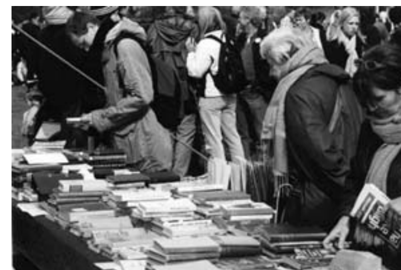
Vild gang i litteratursalg