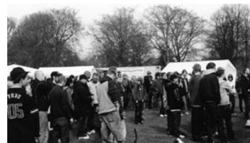
Der var tusinder af deltagere på Den Røde Plads i løbet af majdagen