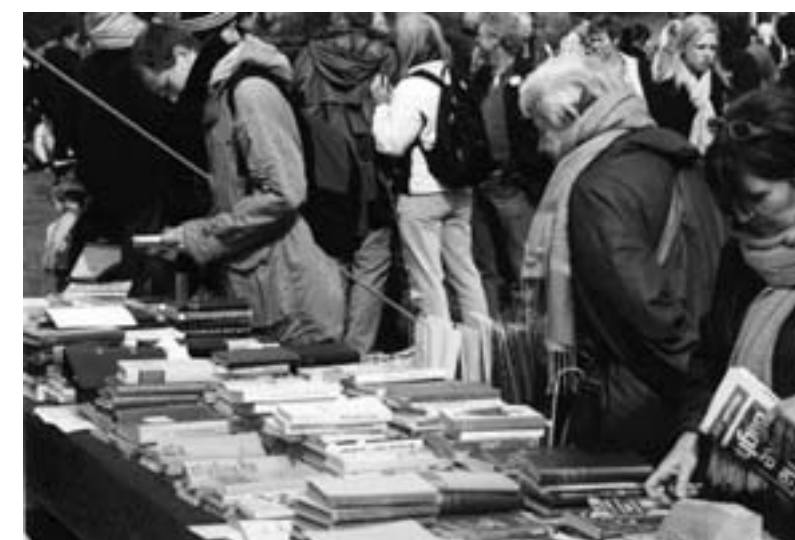
Vild gang i litteratursalg