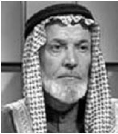
Dr. Harith Al-Dari

Mere end 200.000 irakere har mistet livet i løbet af de tre års amerikansk ledede besættelse af Irak. Det sagde dr. Harith Al-Dari, leder af Rådet for Muslimske Lærde, der er sunnimuslimernes