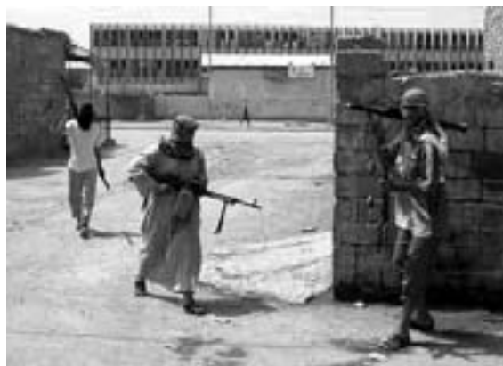
Modstandskæmpere i Ramadi, maj 2006

Vi har været på gaderne mod den krig igen og igen – i titusind- og hundredtusindvis og millionvis mod krigen – ver-