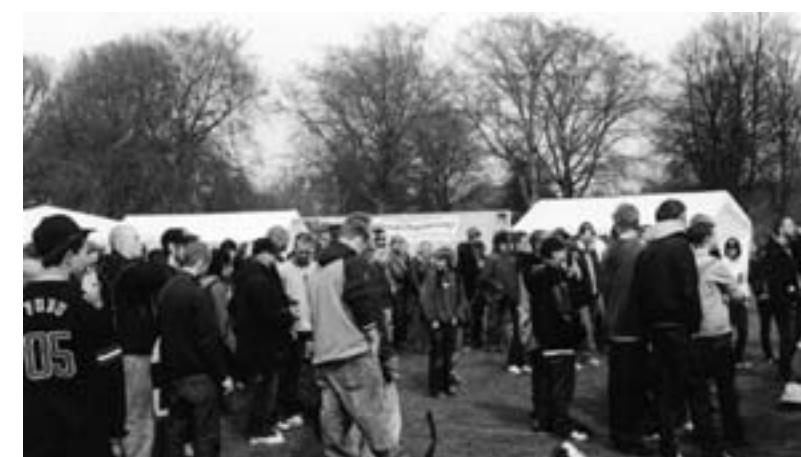
Der var tusinder af deltagere på Den Røde Plads i løbet af majdagen