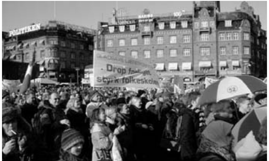
Lærerprotest i marts - nu skal alle på gaden

Det store flertal af danskerne vil imidlertid ikke have Foghs anti-velfærdsreform eller hovedelementerne i den. De vil ikke have hævet pensionsalderen, ødelagt efterlønsordningen, forringet dagpengene eller SU'en. De unge og