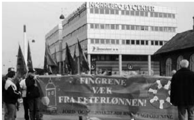
1. maj demo i København: Red efterlønnen