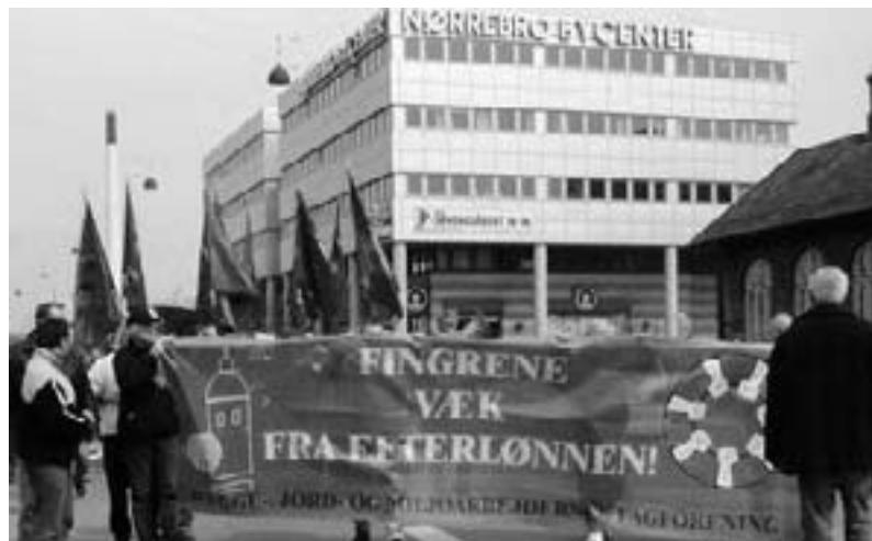
1. maj demo i København: Red efterlønnen