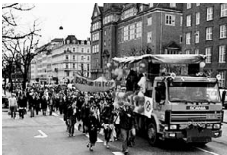
Budskab fra Græsrodderne og Christiania i demo