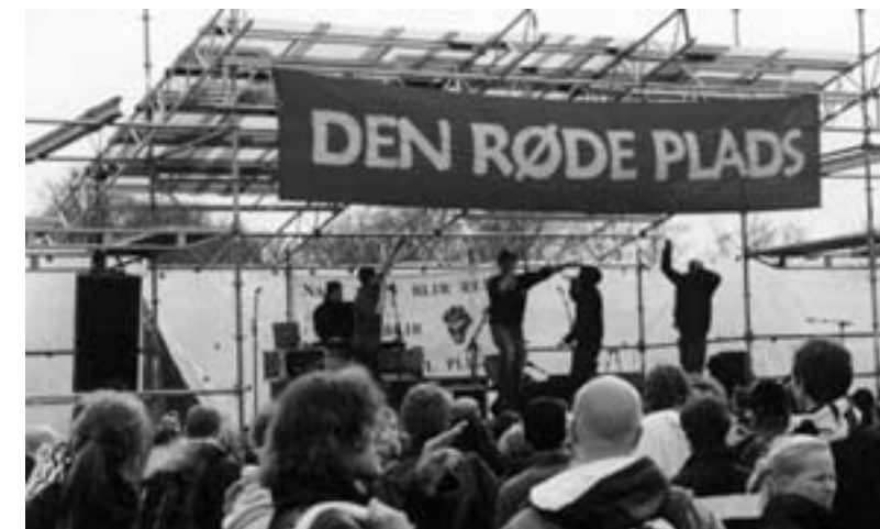
Den Røde Plads i Fællesparken - IUL2006 holder 1. maj

Ikke mere krig – ikke mere social udplyndring!