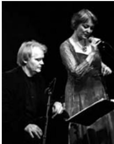
Michala Petri og Lars Hannibal ved mindekoncerten i Den Grå Hal

“Los Angeles Street er et hjemsøgt sted i et af de mest trøstesløse kvarterer i hele verden: Downtown Los Angeles. Om natten – nedenunder skyskraberne, som strækker sig som Babelstårnet mod en sort himmel – er denne gade befolket af mørke, affald og tusindvis af hjemløse, som kryber i ly i papkasser. Lige før jul kom en lillebitte kvinde i en stor gammel overfrakke hen til min kone, Annisette, hun smilede og kærtegnede Annisettes ansigt med begge sine knoglede hænder, og sagde: 'Dig genkender jeg, skønne Moder af Tijuana, velkommen, jeg elsker dig...’”