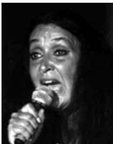
Anisette ved mindekoncerten

dene, fra det oversvømmede sorte arbejderkvarter i New Orleans, i metro'en i New York.. Musikken kan inspirere, vejlede, forskønne sjæle.