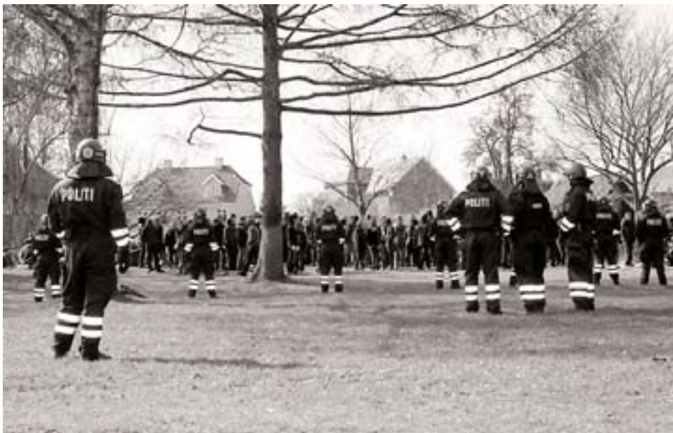
TV: Gruppen af antifascister på toppen af bakken i Krøyers Have.