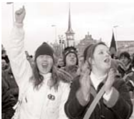
De unge er parat til at vælte Foghs antivelfærds-reform

reaktion på et politisk system, der ifølge de unge er hermetisk lukket for udefrakommende forbedringsforslag og kritik.