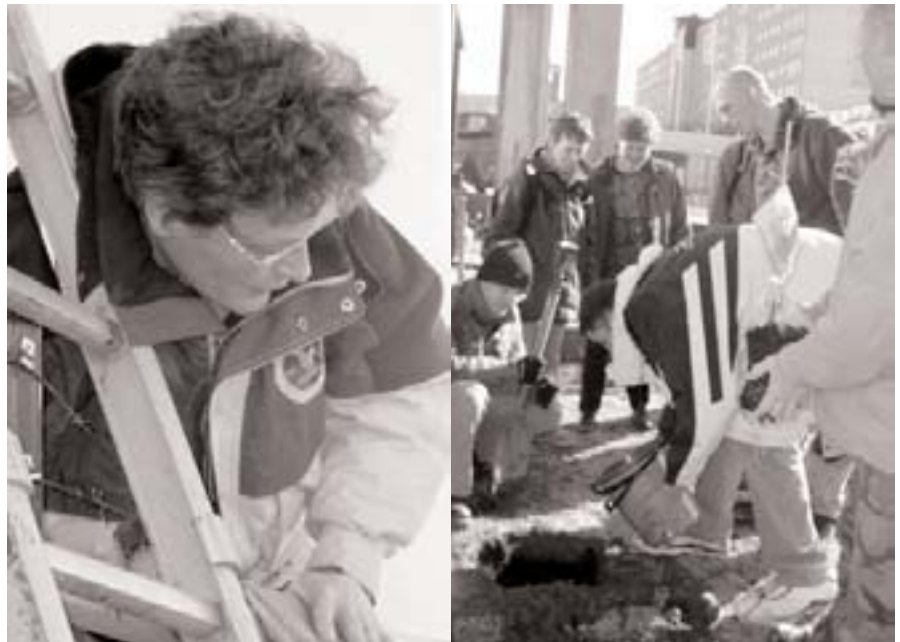
Fotos fra den farlige træplantnings aktion ved Ericsson Microwaves i Mölndal, Sverige.

Alligevel blev seks anholdt for denne farlige forbrydelse. Den ene af dem blev tilbageholdt natten over. Plantningen skulle illustrere behovet for en anden produktion end - våben og bomber.