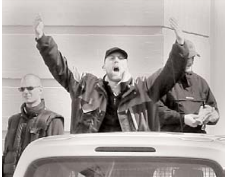
Dansk Fronts frontfigur Julius Børgesen råber af de 200 antifascister

Dette var tydeligvis ikke tilfredsstillende for de forsamlede, hvoraf mange var nazister, så de opløste sig og begyndte at bevæge sig imod Krøyers Have i mindre grupper. Derfor blev den antifascistiske blokade allerede tidligt