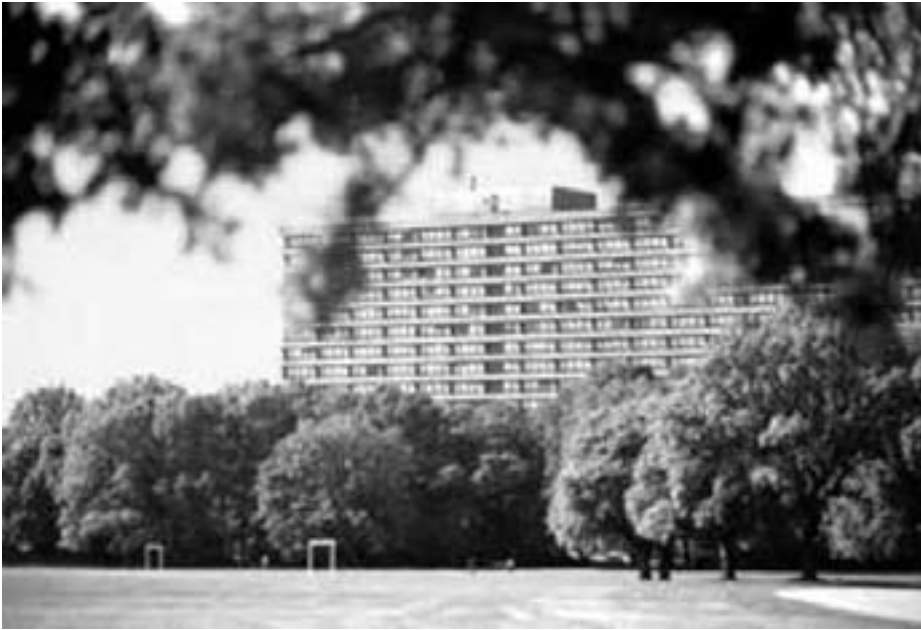
Rigshospitalet - Sygdomsfabrik

økonomiske interesser. Det er kapitalismen, nyliberalismen, der er skurken – og dens politikere og administratorer bærer hovedansvaret.