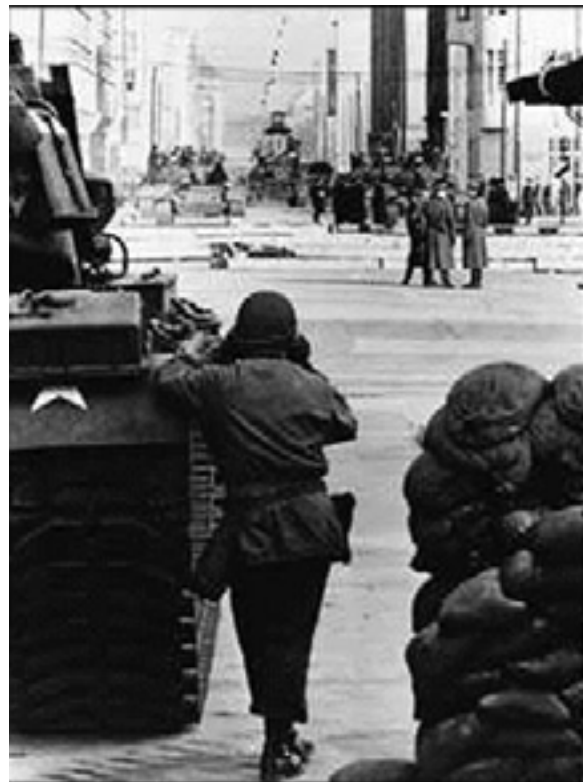
Berlin under den kolde krig: Den amerikanske besættelseszone.

Rapporten er bl.a. bemærkelsesværdig derved, at den på afgørende punkter bryder med den officielle historieskrivning og al den oppustede propaganda, der er øst ud over befolkningen med det formål at fremstille Sovjetunionen og dets allierede som blodtørstige bæster, der dag og nat pønsede på at angribe og