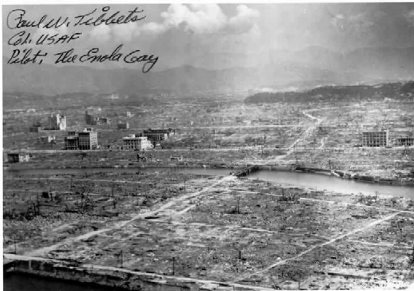
Det ødelagte Hiroshima set fra Enola Gay – flyet, der kastede a-bomben med kælenavnet 'Litte Boy' og var opkaldt efter moderen til piloten, oberst, senere general Tibbet (!).

view med Newsweek i 1963 uden omsvøb erklærede, at 'japanerne var parate til at overgive sig, og det var ikke nødvendigt at ramme dem med denne forfærdelige ting'.