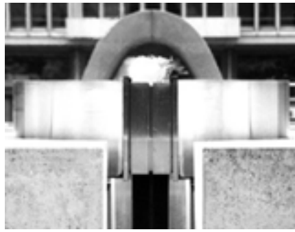
Hiroshimas fredsflamme, der brænder til det sidste atomvåben er destrueret.

Hvornår hører vi pressen undre sig over Bush-doktrinen "kamp for demokrati"? Mens Imperiets repræsentanter højtideligt overværer begravelsen af den Saudiske "konge" over et samfund, der hugger arme, ben og hoveder af folk hver fredag og udviser meget, meget få demokratiske træk? Samtidig med at Bush-regeringen kalder Venezuelas Chavez 'diktator', på trods af at han over blot et par år ubesværet har