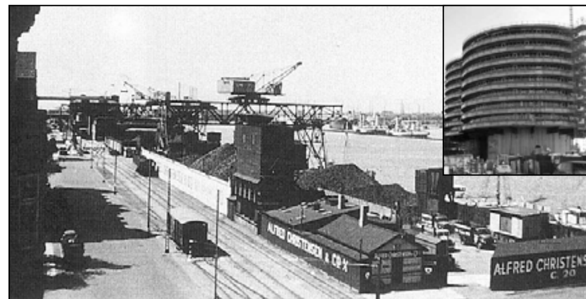
Den gamle 'Sojakage-kaj' - nu kodylt penthousebyggeri

“Bryggen” er nu totalt forvandlet. Den er blevet mondæn. De gamle arbejdspladser er omdannet til dyrt og hypermoderne kontor- og boligbyggeri. Den er ikke længere en isoleret ø kun 10 minutter fra Rådhuspladsen – men et investeringsområde.