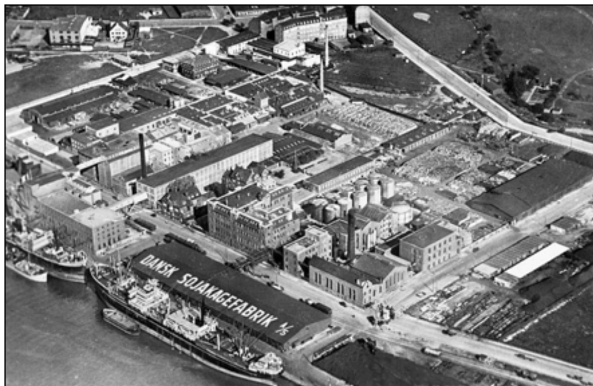
Islands Brygge ca. 1950

Islands Brygge har altid været noget særligt i København – en afgrænset by i byen, som har levet sit eget mere eller mindre stilfærdige og upågtede liv. Nu fejrer bydelen sit 100 års-jubilæum med en stor festival i hele bydelen fra den 2. -18. september.