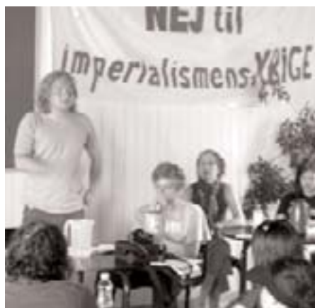
Diskussion sommerlejr 2005

Vi har i særlig grad bekræftet vores solidaritet med det irakiske folks legitime modstandskamp, som har bragt Bush og Co's planer om verdensherredømme i alvorlige vanskeligheder – og med det palæstinensiske folks heroiske