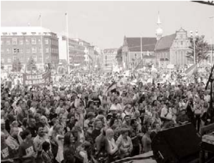
Udsnit fra Christiansborg Slotsplads

Demonstrationen mod Bush-besøget og alliancen mellem klonerne Bush og Fogh blev den største overhovedet siden protesterne op til starten på aggressionskrigen mod Irak i februar og marts 2003. Omkring 30.000 mennesker demonstrerede ved den amerikanske ambassade og foran Christiansborg i en markering, der understregede, at massedemonstrationernes tid langtfra er forbi..