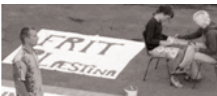
Aktion sommerlejr 2005

nenter og fra hele den europæiske union vil samles i Nordsjælland for at udveksle erfaringer, lære af hinanden og lære at kæmpe sammen. Mere end nogensinde gælder det, at kampen er international og at alle modstandskræfter må slutte sig sammen mod en stadig mere barbarisk og brutal fjende.