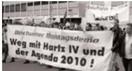
I Tyskland kæmpes der mod 'Agenda 2010'. Her demonstration i Gelsenkirchen 14. maj.

Derfor har beskæftigelsesministeren nu fremlagt en handlingsplan, der lægger op til at styrke de private jobfor-