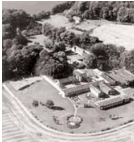
Den internationale landsby ved Sjælsø 2006

Sidst i juli og begyndelsen af august 2006 vil Nordsjælland/København summe af revolutionære ungdomsaktiviteter. Ved Sjælsø nær Hørsholm, godt 20 kilometer fra Københavns centrum, vil der opstå en hel international landsby af unge mod fascisme, racisme og imperialismen. De vil komme fra mere end 20 forskellige lande og fra alle kontinenter for sammen med hundreder af danske unge at få greb om verdensungdommens situation og kampe i dag, udveksle erfaringer, lære af hinanden og bare være sammen. De kæmpende folks kultur og musik vil sætte deres præg på lejren – og det vil også sætte spor i København.