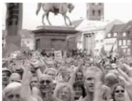
Fra Christiansborg Slotsplads

Desværre lykkedes det ikke at få en politisk diskussion i koordinationskomitéen omkring talernes indhold. Der er to holdninger til hvad bredde betyder, for mig betyder det, at der skal være plads til at alle holdninger, der ikke er i modstrid med det fælles grundlag kan komme til orde, for andre betød det, at støtten til modstandskampen i Irak og en klar anti-imperialistisk holdning til Bush's politik ikke kunne komme til udtryk fra talerstolen. At dømme efter paroler og bifaldene til kunstnernes bidrag var der en tydelig støtte hertil blandt demonstrationsdeltagerne.