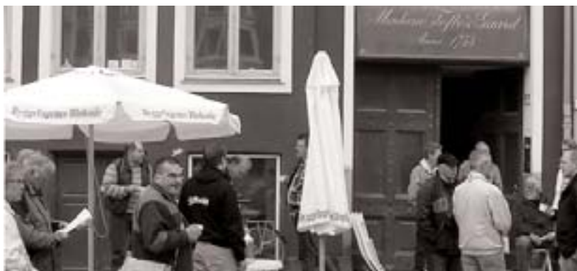
Fra blokaden mod Nyhavn 53

Det danske firma har indgået en helt almindelig tiltrædelsesoverenskomst, og firmaet bliver organiseret i Dansk Byggeri, skriver Fagligt Ansvar på deres hjemmeside.