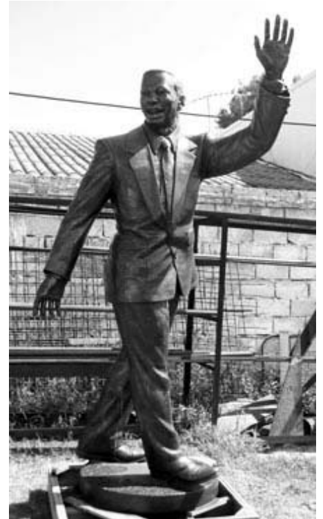
Den 10. internationale konference fandt sted i Ecuador, december 2004. Partierne aflagde besøg ved statuen for kammerat Jaime Hurtado, parlamentsmedlem, myrdet af oligarkiet i 1999.

Denne polemik antog et endnu større omfang ved Konferencen i 2003,