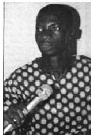
Abib Dodo Myrdet 24. juni 2004

Landet er fuldstændig nedsunket i en anti-folkelig og reaktionære borgerkrig med en alvorlig risiko for at udbrede sig til hele det vestafrikanske område med dramatiske konsekvenser for folkene. Mange af de tusinder af mennesker, som er fordrevne og flygtninge, har været udsat for epidemier og hungersnød uden at få nogen beskyttelse; de har også været ofre for massakrer.