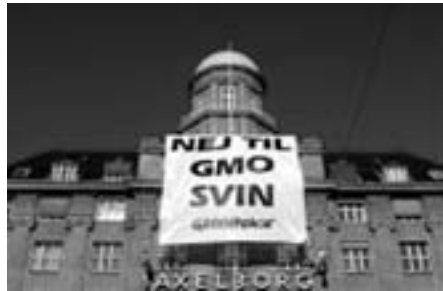
Terrorbanner på Axelborg

Den slags aktioner plejer at udløse en bøde til hver enkelt aktivist - og det har også været tilfældet her. Men nu ville anklagemyndigheden have prøvet, om organisationen selv kunne straffes