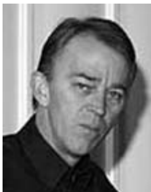
Villy Søvndal: Nu 'socialt' kompromis

Socialistisk Folkeparti indtager en sær-lig rolle på Ja-siden. Da Danmark i 1992 stemte Nej til Maastricht-trakta-ten, spillede SF en hovedrolle i det 'nationale kompromis', som året efter sikrede en tilslutning samme traktat – og nogle danske undtagelser, som siden væsentligt er undergravet.