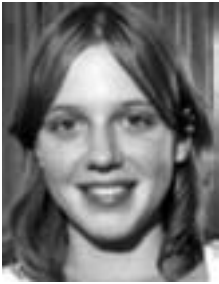
Rina Ronja Kari