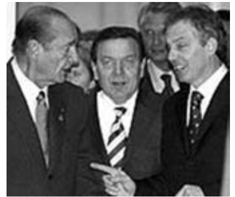
Tre statsmænd i Bruxelles

De borgerlige medier, og ikke mindst tv, har efterfølgende i den forvirring, som forfatningstraktatens død medførte hos unionens elite, gjort deres bedste for at inddæmme 'skadevirkningerne' (dvs. væksten i den folkelige