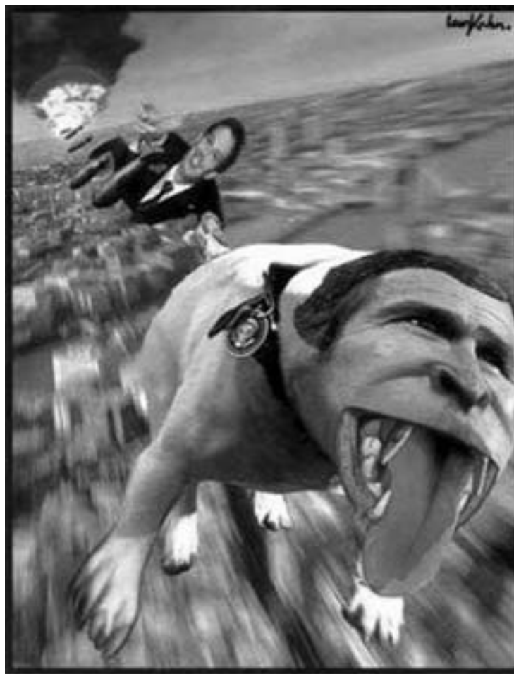
"MAD DOGS AND ENGLISHMEN...."

I disse papirer ligger beviserne på at Bush og Blair og deres nærmeste medarbejdere deltog i en sammensværgelse for at anstifte en ulovlig aggressionskrig mod Irak og bevidst vildlede og manipulere verdensoffentligheden omkring det. Disse papirer er nok til at få dømt de to