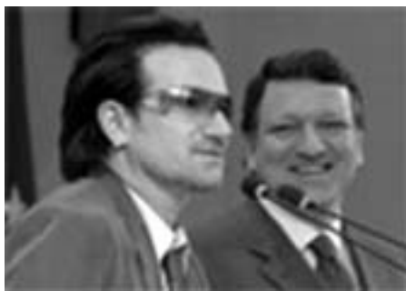
Bono på gale veje med Barosso