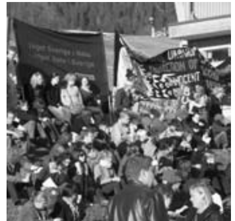
Protest i Aare

“NATO’s samarbejde med andre europæiske ikke-medlemslande finder sted inden for rammerne af EAPC- og Pfp-samarbejdet, som har vist sig at være frugtbar instrumenter for at inddrage ikke-allierede europæiske lande i et konstruktivt samarbejde om øget sikkerhed” (udenrigsministeriet).