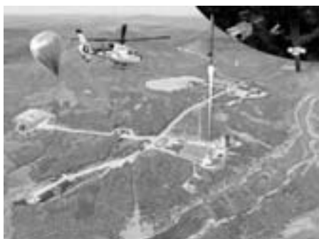
Rumbasen Esrange ved Kiruna

En af de unge talere tirsdag aften mente således, at der er en udvikling i gang hen imod at gøre området til ét stort militært øvelsesområde med forbindelse til Svalbard, der hører under Norge.