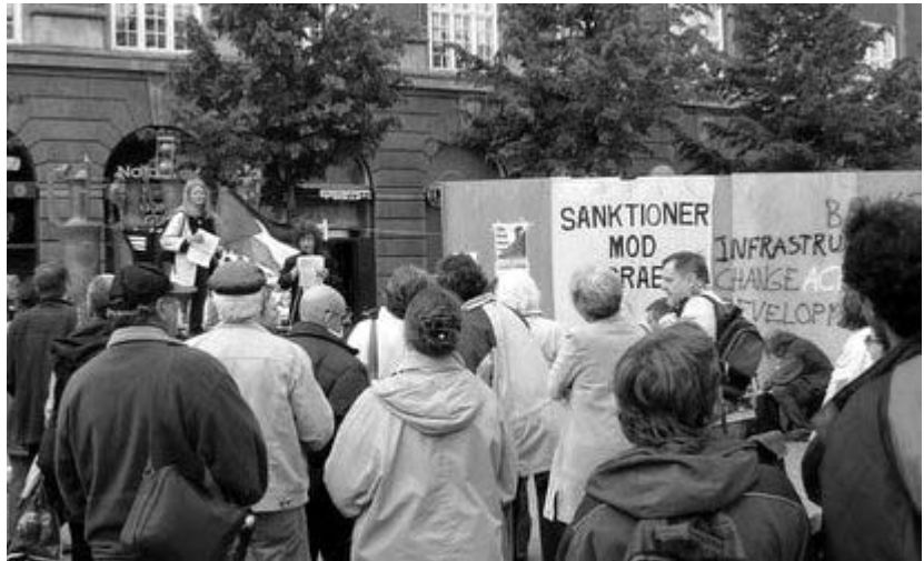
Akseltorv med muren - nu revet ned

Endnu en gang lød protesterne lørdag den 4. juni på Axeltorv i København mod Israels apartheid-mur, der sønderriver Palæstina.