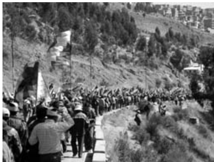
Latinamerikas oprindelige folk i bevægelse (Bolivia)

Til dette formål har den oprettet Det Amerikanske Frihandelsområde (FTAA) og Frihandelsaftalen. Men disse bestræbelser støder op imod massernes aktioner, som har tvunget imperialisterne og de servile oligarkier til at udskyde gennemførelsen af FTAA til et senere tidspunkt end januar 2005, som de ellers havde planlagt.