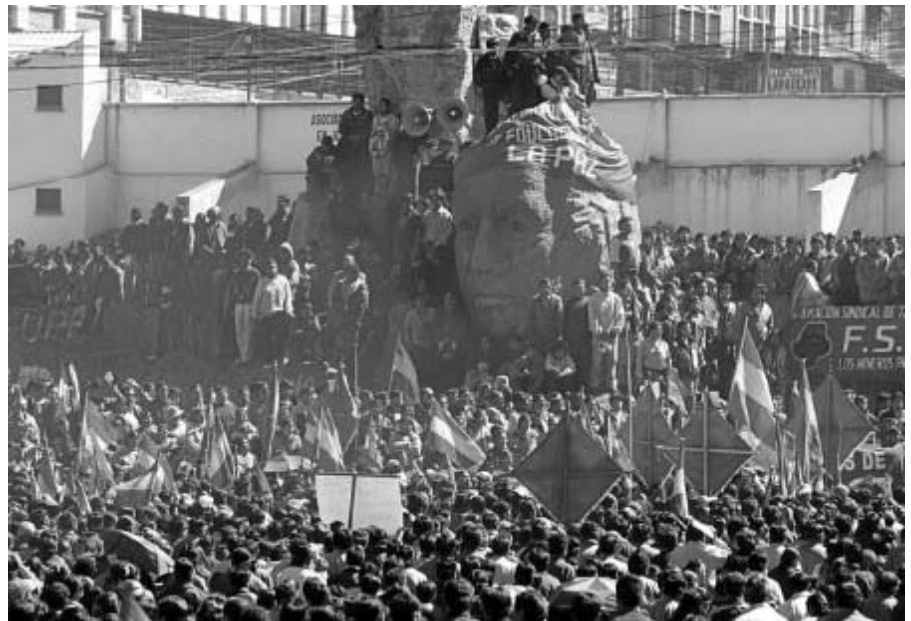
La Paz 6. juni

blev kaldt for 'oliekrigen', der kulminerede med opstanden i oktober 2003, og begivenhederne i de seneste uger ligger direkte i forlængelse af den. Lozada var ansvarlig for oliekontrakter med transnationale selskaber, som på det nærmeste forærede Bolivias vigtigste naturressourcer væk.