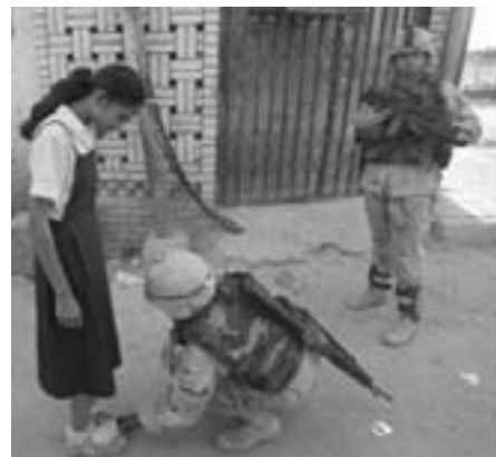
Terrorist - hvem?

Henriksson. - Irakere, som fører væbnet kamp mod okkupationen af deres land, kaldes for terrorister, fordi de er imod den politik, som Bush-regimet vil gennemføre i Irak, mens besættelsesmagtens soldater, tilmed danskere, som bevisligt har tortureret, voldtaget og koldblodigt myrdet irakiske mænd, kvinder og børn kaldes frihedskæmpere, fordi de er Bush-regimets lydige redskaber.