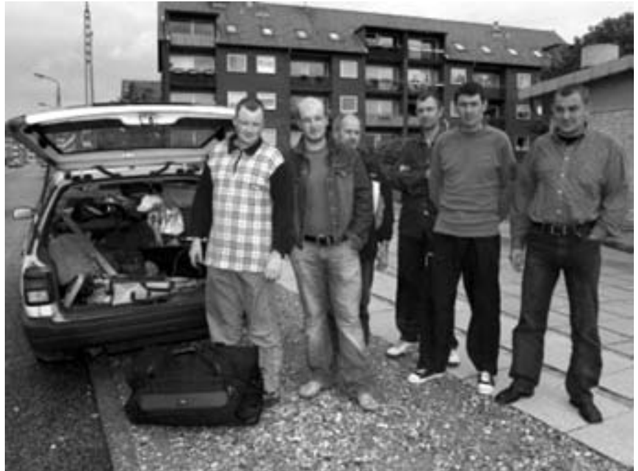
6 litauiske byggearbejdere på vej hjem med tomme lommes. Både legalt og illegalt udnyttes østarbejdere som slavearbejdskraft og løntrykkere.