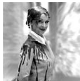
Anne Marie Helger og venner vil også være der...