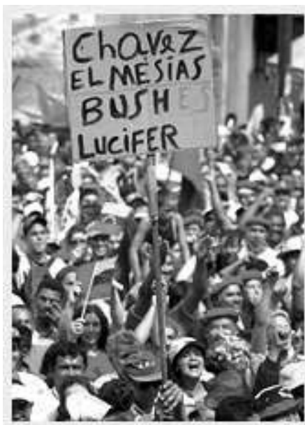
Demonstration mod kuppet: Chavez er Messias - Bush Lucifer

Bandera Roja kæmper ikke kun mod regeringen Chávez, men er udtrykkeligt forbundet med de reaktionære proim-