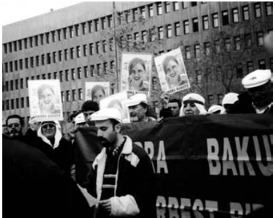
Protestdemonstration i Ankara ved retssagen