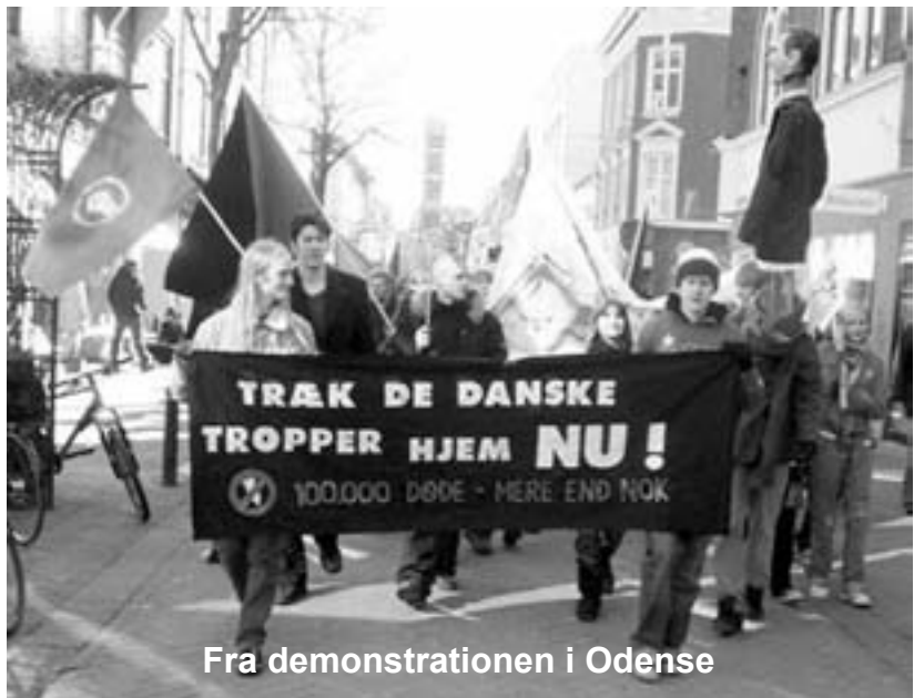
Fra demonstrationen i Odense

Den store demonstration gik derefter igennem byen, forbi Christiansborg og til Christianshavns Torv tæt ved udenrigsministeriet – fuld af kampråb, musik, bannere og paroler med krav om, at de danske tropper trækkes hjem nu, og at besættelsen af Irak ophører.