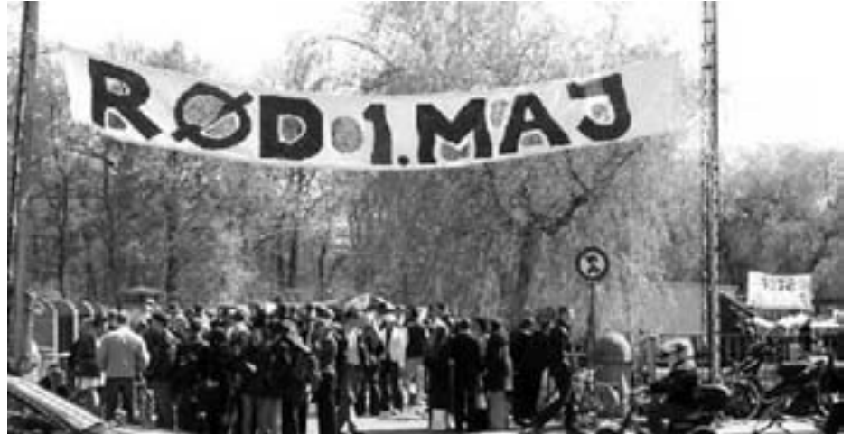
Rød 1. maj i Munkemose er det største fynske arrangement på maj-dagen - og større end de socialdemokratiske klassesamarbejdsmanifestationer