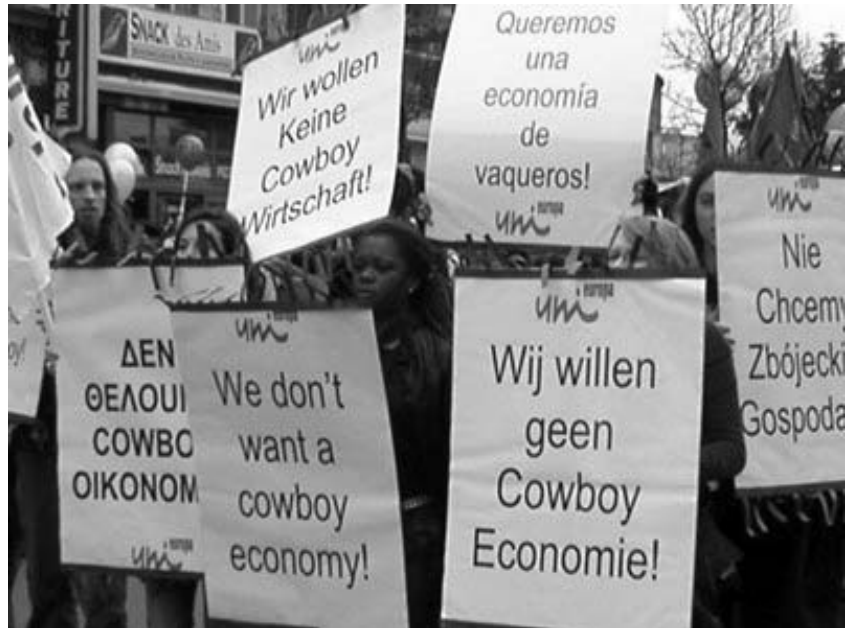
Fra demonstrationen i Bruxelles 19. marts Oversættelse unødvendig!

Lissabon-strategien er sat under et meget stort forandringspres. Næsten alle bedømmelser går på, at vi ikke når