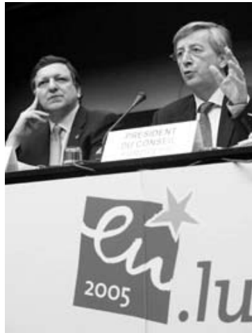
Luxembourgs EU-formand Juncker og kommissionsformand Barroso

Opinionsundersøgelser viser i øvrigt, at kun 11 procent af vælgerne i EU-landene har læst om forfatningen. Ikke læst forfatningen – men læst (hørt!) om forfatningen!