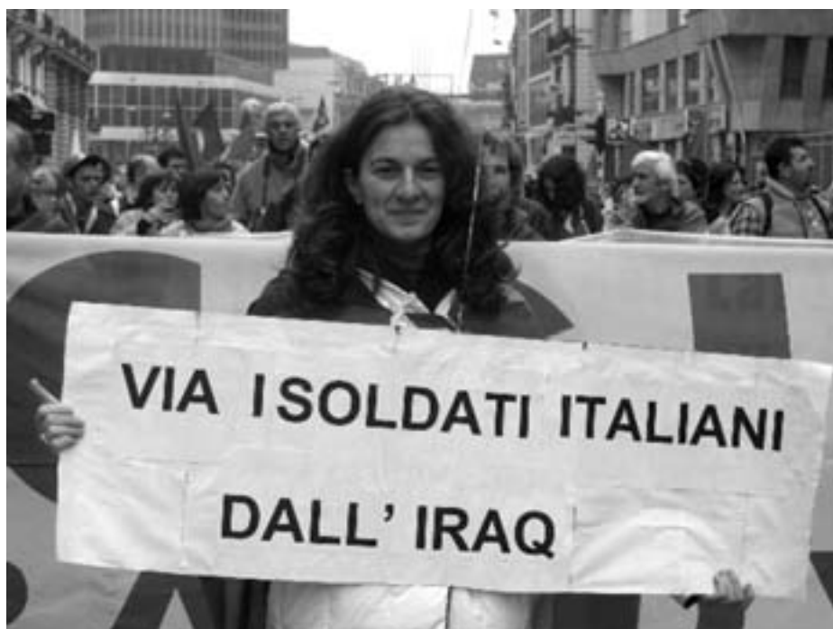
Antikrigsprotest ved topmødedemoen i Bruxelles

je verden støttede demonstrationernes hovedparoler i det store og hele ubetinget den irakiske modstand. I de krigsførende lande lå hovedvægten naturligt nok på kravet om at afslutte besættelsen og trække de egne tropper hjem. Blandt deltagende grupperinger, der støtter dette krav, men ikke står på antiimperialistiske positioner, fremføres, at de skal erstattes med FN-styrker i en eller anden form.