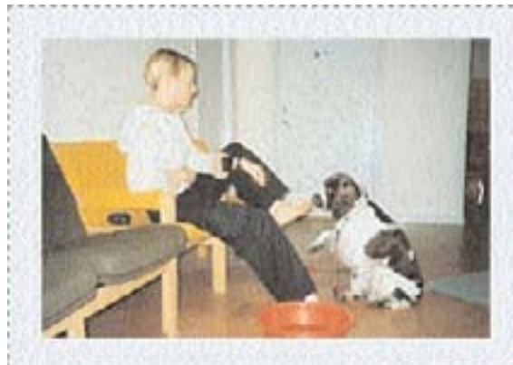
Aktivering: Normalt noget for hunde

- Jeg vidste ikke, at de aktiverede var så kede af deres dagligdag. Det vil jeg omgående se på, og jeg tager sagen meget alvorligt.