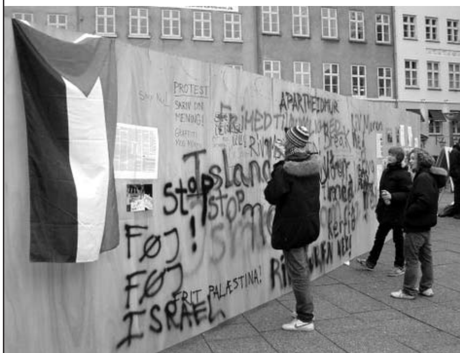
Fra “Riv Muren Ned”s aktion på Kultorvet fredag den 25. februar