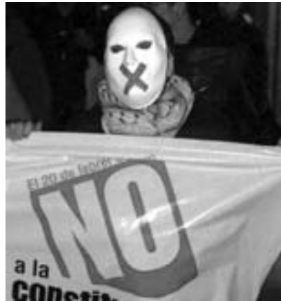
Fra den spanske nej-kampagne

Hvordan kan deltagelse i en union med nogle af verdenshistoriens værste imperier og kolonimagter være en fre-