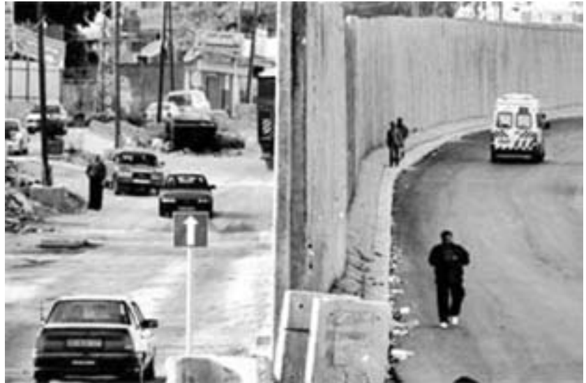
Israelske tropper afslutter de sidste stræk af Apartheidmuren i Jerusalem

En skræmmende plan for Palæstina tager form bag de israelske slogans om "afvikling", bag det britiske "initiativ for genoplivning af køreplanen for fred" og bag USA's anstrengelser for at gennemtvinge fuldendelsen af de israelske planer, der skal fuldføre bantustaniseringen af det palæstinensiske folk. Alle tre faktorer samvirker til at arbejde for en afslutning af al palæstinensisk modstand, hvilket man ser som en betingelse for kontrol af Mellemøsten fra Jerusalem til Bagdad. Særlig USA's administration er helt bevidst om, at den eneste mulige chance for succes med besættelsen af Irak og for amerikansk-israelske planer om at forme fremtiden for Mellemøsten i bredere forstand afhænger af deres evne til at