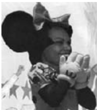
Condoleezza Rice på charmeoffensiv

stærk overrepræsentation af stemmer og medlemmer af den ny 'grundlovgivende' forsamling i forhold til andelen af befolkningstallet: 25 pct. På tredjepladsen kom Allawis liste med angiveligt godt 13 pct. af de afgivne stemmer ved det fiksede valg.