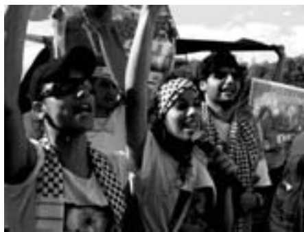
Demonstration i Porto Alegre

Mens den væbnede modstand er enorm og konsolideret, så er den politis-