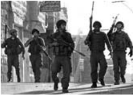
Den israelske terror fortsætter uanfægtet (13. januar 2005): Israelske besættelsesstyrker terroriserer byen Tarqumia i nærheden af Hebron på Vestbredden, efter at have dikteret udgangsforbud for borgerne.