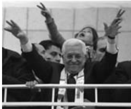
Mahmoud Abbas: Vinder uden jubel

Medierne har generelt fremstillet det som om det store problem for 'freden' har været et demokratisk underskud hos palæstinenserne - og ikke det apartheidlignende Israels ulovlige besættelse.