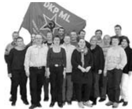
Hvordan synes i selv det går?

I praksis altså ingen forskel fra tidligere forsøg som f.eks. Chile, hvor regeringen fik under tre år, før den blev