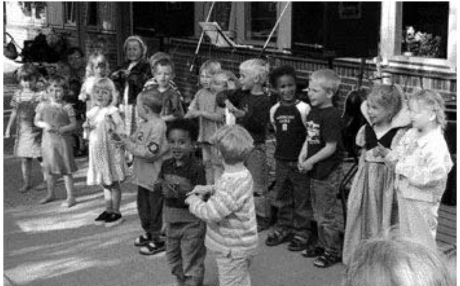
Det drejer sig da om børn - gør det ikke?

- Det er rigtigt, at det er uklædeligt, at sådan nogen som mig stiger så meget i løn på en gang; men det er en følge af, at lønningerne i FOA er så meget højere. Det må fremstå som urimeligt; men det er ikke muligt at gøre det ret meget