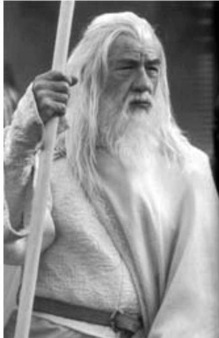
Gud ligner Gandalf fra Ringenes Herre - han er 3 meter og 65 og 500 kg solid muskelkraft.

Om den kosmiske rejsevirkosomhed sagde Gud, at det havde noget at gøre med strenge-teorien ('String Theory'), mange dimensioner og udskiftning af rum. Om sin begejstring for USA hævdede Gud, at de mest troende er de mest påvirkelige – et amerikansk træk, han synes godt om – og det er lettere at være Gud, når der er et flertal af tilhængere, som ikke stiller spørgsmål. Desuden, sagde Gud, kan han lide den støtte, han får i USA i denne tid, og han regner med, at adskillelsen mellem kirke og stat vil ophøre endeligt under præsident George W. Bush.