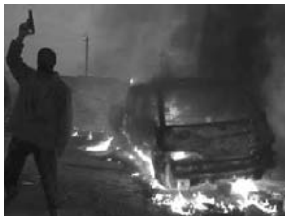
TH: Angreb påamerikansk konvoj Mosul 2004

som kan minde om den, der blev formuleret af Danmarks Frihedsråd, udsendt et åbent brev til organisationer og grupper i mange lande ( Se midtersiderne i dette nummer af Kommunistisk Politik )