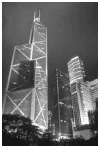
Bank of China

monopolisere deres position ved at forøge deres investeringer, således at deres kinesiske partnere ikke længere økonomisk kan følge med. Desuden tilføjer de multinationale virksomheder efterhånden også først og fremmest investeringer i form af at lancere deres eget mærke (branding) og ikke i form af materielle investeringer. 4