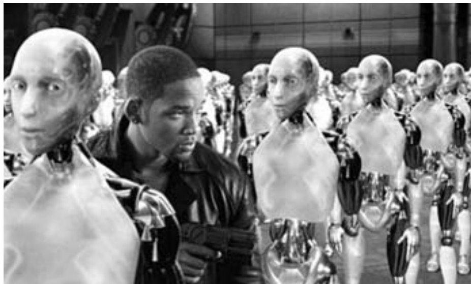
I, Robot Relevante spørgsmål

Ved at erstatte dyret med en robot kan vi i denne lille analyse vise problemerne, som diverse forestillinger går i en stor bue uden om. Fordrukken eller på anden måde afhængig af bare kaffe eller røg, nej, det er ikke teknisk muligt, der er i det hele taget intet, som en computer kan indtage, som vækker bare en antydning af fornøjelse. Far, familierelationer, et hjem eller andre bånd er ligeledes meningsløse, når der