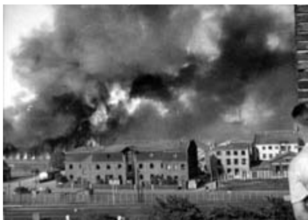
TV: BOPA sabotage mod Riffel- syndikatet, 1944