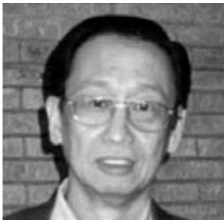
José Maria Sison

I et panelmøde deltog bl.a. en repræsentant for den amerikanske antikrigsorganisation ANSWER, der rede-