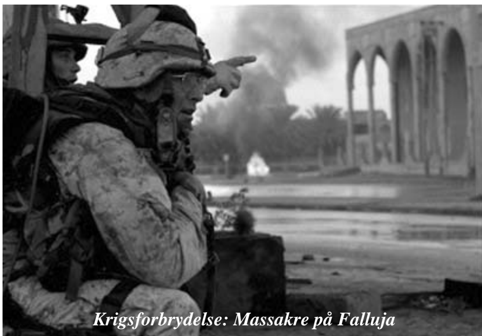
Krigsforbrydelse: Massakre på Falluja