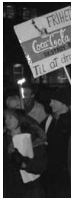
Fakkeldmonstration ved den ame 12. n

Påskuddet for at sønderbombe en hel by og lem-læste dens indbyggere er det såkaldte valg i januar. Der skal skabes ro, siger man. Så valget kan løbe ad stablen. Men tag mig på ordet: VALG-