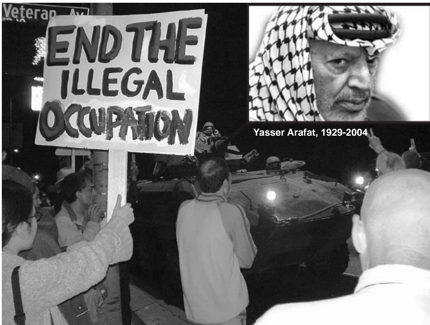
Yasser Arafat, 1929-2004

Marinetanks dukker op ved antikrigsdemonstration, Westwood, Los Angeles, 9. november