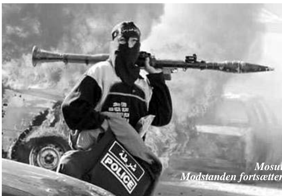
Mosul Modstanden fortsætter