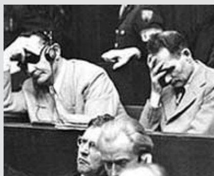
Göring (TV) og Hess (TH)

(b) Krigsforbrydelser: nemlig krænkelser af love eller sædvaner for krigsførelse. Sådanne krænkelser rummer, men kan ikke begrænses til, mord, mishandling eller deportation af civilbefolkningen fra eller i besat område til slavearbejde eller med noget andet