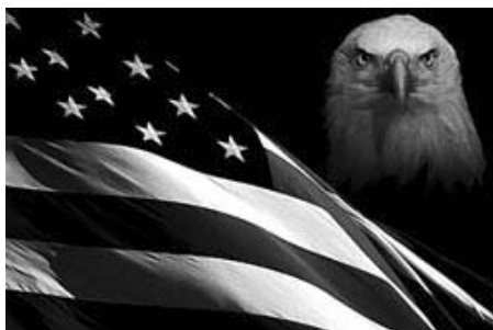
Fascisme på amerikansk: Indsvøbt i flaget

hvorpå Kongressen eller offentligheden kan holde disse mennesker ansvarlige for, hvad de gør. I realiteten indføres der straffrihed for deres gerninger under skin af immunitet for de udøvende. Så hvad vi får her, er meget af det fascisterne opnåede, samtidig med at den demokratiske facade opretholdes. Disse enorme skattelettelser er for de rige. Der findes nu store virksomheder, som tjener milliarder af dollars i ren profit, og som ikke betaler en øre i skat.