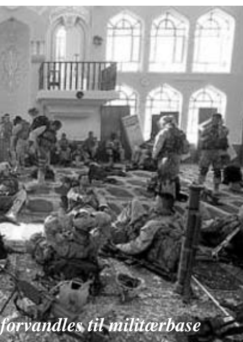
forvandles til militærbase

Til sidst vil jeg gerne sende en tanke til både de civile og modstandsfolkene i Falluja. Jeg vil sige til dem, at ingen af dem vil dø forgæves. Falluja og dets indbyggere vil altid stå som et symbol på folket, der gjorde helvede hedt for imperialismen. I vil aldrig blive glemt.