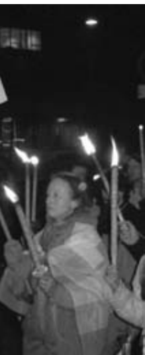
Massakren på Falluja den danske ambassade september 2004

Dhahir, Komiteen i Irak, ved foreningen i Odense