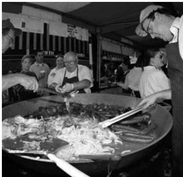
Forbrugsfesten er forbi - før den kom i gang

Den dystre udvikling blev også bekræftet på en konference, som Dansk Arbejdsgiverforening (DA) havde indkaldt. Debatten handlede om 'velfærd', og deltagerne bestod af eksperter og politikere fra blandt andet Velfærdskommissionen og Arbejderbevægelsens Erhvervsråd, som hurtigt kunne blive enige om, at globaliseringen med den voldsomme lønforskel mellem Danmark og specielt Østasien udgør en