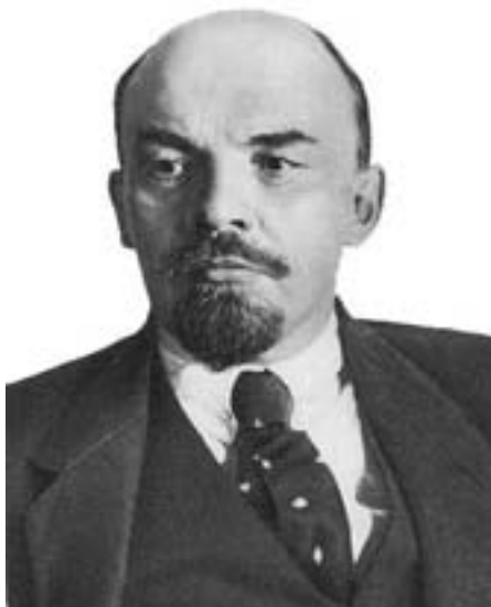
Lenin omkring den tid han var til kongres i København - og boede på Vesterbro

I virkelighedens verden stadfæstede socialdemokraterne her den politik, som gik ud på at holde arbejderklassen på den plads downstairs, der var tilmålt den af ‘herskabet’ upstairs — og først og fremmest at ‘holde ro på bagsmækken’.