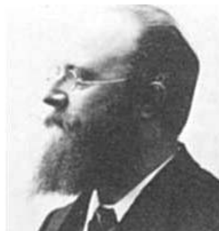
Thorvald Stauning - dansk højresocialdemokrat - fulgte trop i forræderiet mod socialismen

tive eksempel fik betydning for millioner af mennesker i mange år derefter.