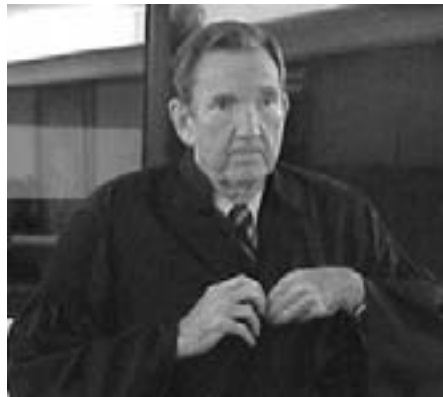
Den tidligere amerikanske justitsminister Ramsey Clark - selv ekspert i international ret - har skrevet vedstående anklageskrift mod Bush og Co., der blev behandlet ved krigsforbrydertribunalet i New York

den – krigsførelse mod civile og ødelæggelse af adgang til basale fornødenheder,