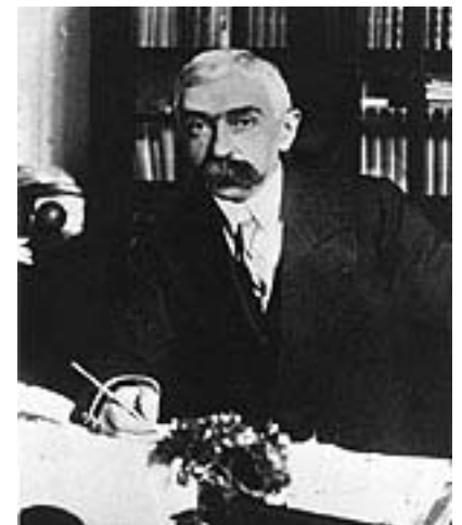
Pierre de Coubertin

- Coubertin udtalte, at den største forbrydelse var at lære ungdommen pacifisme, og han skriver, at slaget ved Waterloo egentlig blev vundet på