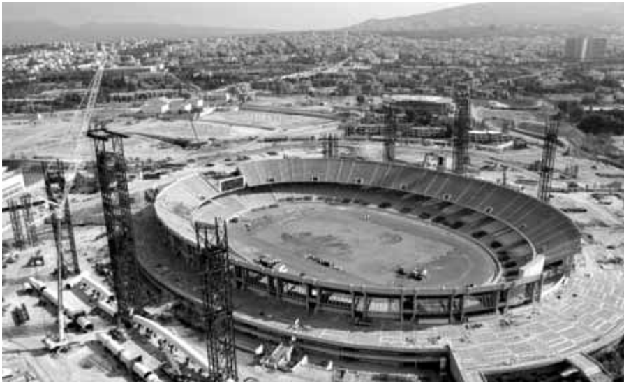
Den forcerede bygning af det olympiske stadion og andre faciliteter har kostet snesevis af arbejderes liv

Der er gået mere end et århundrede, siden De Olympiske Lege sidst blev holdt i Grækenland. Det har naturligvis