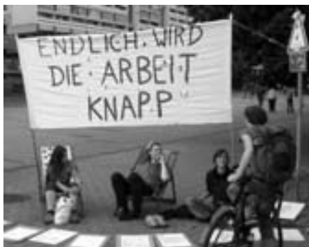
Endelig: Slut med arbejde!

Væk med den socialdemokratisk-grønne regerings lovpakke Harz IV og Agenda 2010 Den tredje mandag i træk demonstreredes i 160 byer