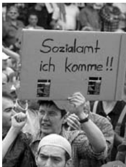
"Socialkontor her kommer jeg!!"

forringelser fandt også sted i Tyskland i november måned, hvor der var organiseret en landsdemonstration med over 100.000 deltagere.