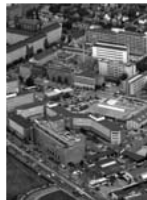
- og dets kompleks i Valby

Lundbeck A/S har gennem de senere år tjent tykt på antidepressive piller (såkaldte lykkepiller) og er nu i gang med udviklingen af medicin mod demenssygdommen Alzheimers, en sygdom, der er i hastig vækst. De udvider konstant hovedsædet i Valby, hvor de nu udgør en hel by i bydelen. Det er således den eneste virksomhed i København, der har fået dispensation til at opkøbe en hel vej, Ottiliavej.