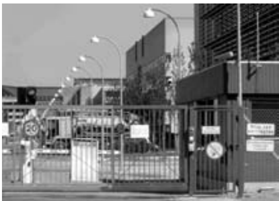
Velkommen til Lundbeck