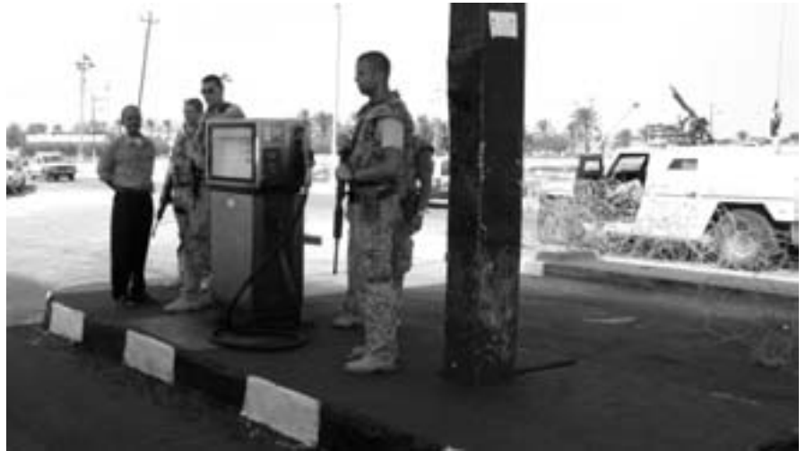
Danske forhørsmetoder kaster benzin på bålet i det ulovligt besatte Irak.