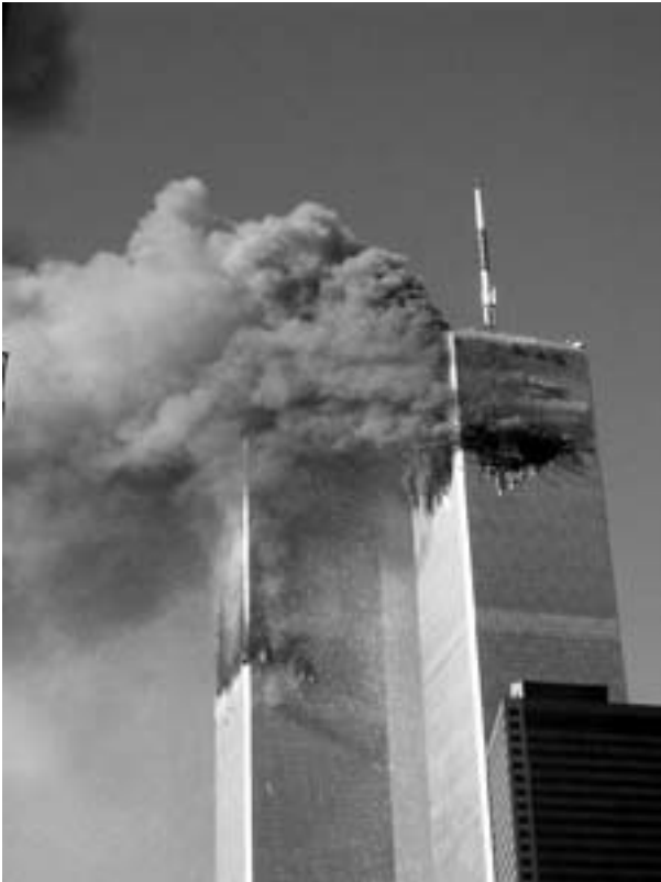
Terror er givtigt for udløsning af "nyttige kriser"

projekt. 'Krig mod terror' står på begge partiers dagsorden. Alle amerikanske regeringer siden Jimmy Carter har støttet de islamiske brigader og brugt dem i hemmelige efterretningsoperationer.