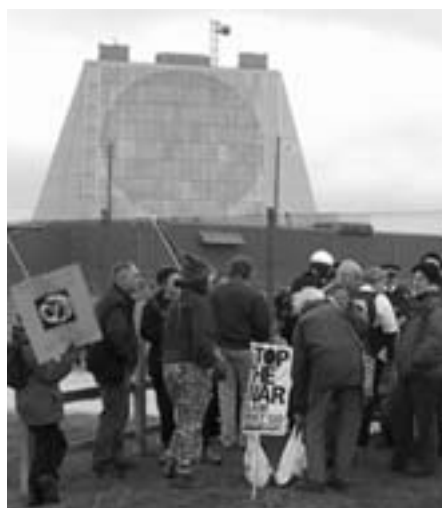
Protest foran Fylingsdales radaren

Dette giver mig anledning til at spørge vores regering, om vi, som jo også er med i Nato's atomvåbenstrategi, har fået indført et dansk atomvåbensystem eller andel heri af bagdøren på Thule? Hvem er ansvarlig for en sådan handling og kan stilles til ansvar? De såkaldte små atombomber er måske nok blevet mindre i størrelse, og den radioaktive grænseværdi er sat ned til 1-5 kilotons,