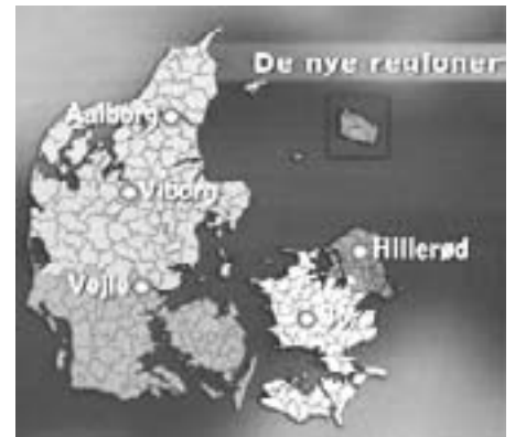
Fra 2007 skal Danmark inddeles i 5 regioner, med nye "regionshovedstæder"

i samfundet, medens erhvervslivet lades i fred.