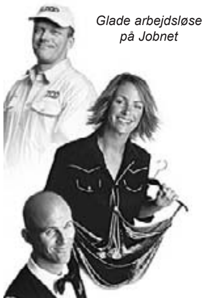
Glade arbejdsløse på Jobnet

Parallelt med konsekvenserne af "stordriftsfordelen" betyder reformen også på andre leder færre arbejdspladser. Sigtet med reformen drejer sig ikke mindst om at fortsætte udliciteringen og privatiseringen af de tilbageværende