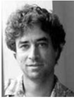
Antonio Negri (TV) og Michael Hardt - Intellektuelle guruer for en del af antiglobaliseringsbevægelsen. I realiteten skønmaler de imperialismen.

intet, der tyder på, at staten er døende. Nogle stater har det bedre end andre, det er klart. Den irakiske stat lider i øjeblikket af at være fuldstændig under administration af USA og UK. Storbritannien og de multinationale selskaber, der støttede krigen, viste, at EU ikke har reel styrke til at føre en samlet udenrigspolitik, og at interesserne ikke er så fælles, som man havde håbet. Andre overnationale instrumenter såsom verdensbanken og IMF er i overvejende grad styret af USA og til dels EU og Japan. Herfra kommer størstedelen af lederne og ofte også størstedelen af pengene. Heller ikke disse overnationale instrumenter ændrer ved nationalstaternes rolle.