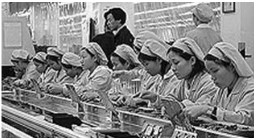
Hvor arbejdskraften er billig. Nokia i Kina.

- For fem år siden etablerede store virksomheder som Danfoss og Lego sig i Østeuropa. I dag er det helt almindeligt, at underleverandører med få ansatte etablerer afdelinger i Kina, og antallet er stærkt stigende. For et par år siden var andelen af maskinleverandører med eksport til danske virksomheder i udlandet fem procent. I dag er