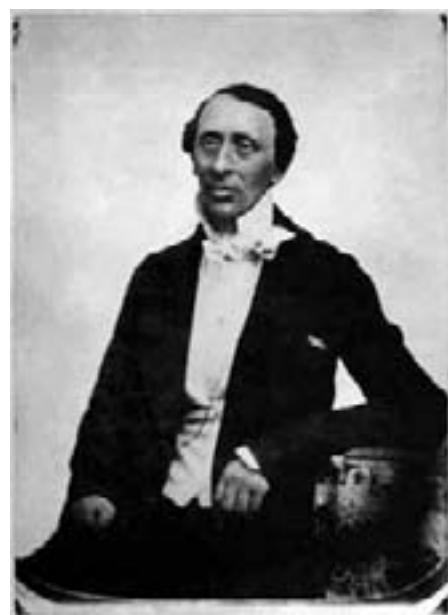
Eventyrdigtende realist i stiveste puds

Som gæst hos de besiddende betragtede Andersen overklassen udefra og nedefra, og hans eventyr er gennemstrømmet af underklassens uafledelige had, og uforenelighed med den herskende orden, der er humor, bitter ironi, snuhed i eventyrene – De er almuens visdom og ældgamle erfaring gennem århundrede – geniale, enkel i sprog og tanke, med et håb og en længsel efter forandring og oprør mod den til enhver tid