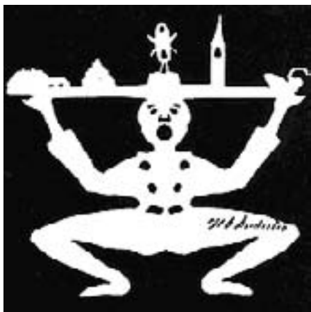
Papirklip af H.C. Andersen

I sig bar han på underklassen og fattiglemmernes virkelighed, der ikke kunne forenes med det fremvoksede borgerlige samfunds akademiske æstetik.