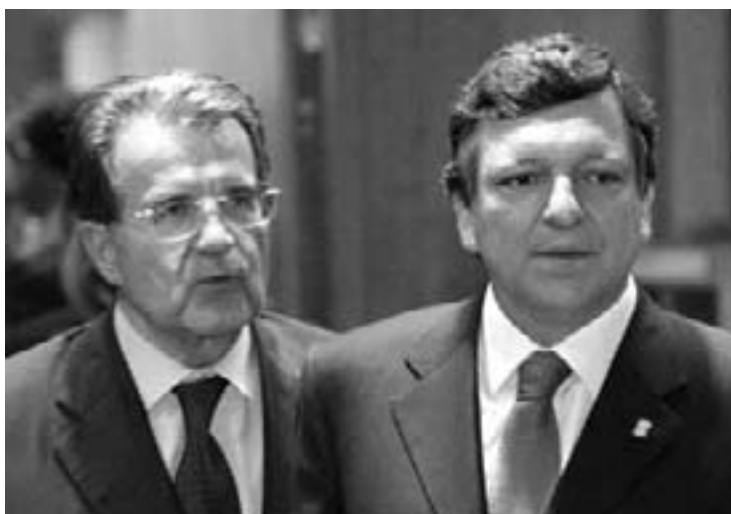
Superstaten har fået sin udenrigsminister og statsminister: Til venstre Javier Solana, udenrigsminister -tilhøjre Portugals premierminister José Barroso som bliver ny kommissionsformand - undskyld var det præsident?

Nu skal unionsforfatningen gennemføres på trods af udbredt folkelig modstand i en lang række af EUs medlemslande