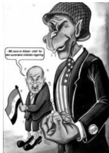
- Mit navn er Allawi - chef for den suveræne irakiske regering

Den nye regering er intet andet end en kopi af det Regerende Råd, som var kommet i miskredit, fordi det tjente som et redskab for besættelsesmagten. Regeringen afspejler på ingen måde de patriotiske forhåbninger hos vort folk, der kæmper for såvel befrielsen af vort besatte land som opnåelsen af fuld suverænitet og national uafhængighed. Over for vort folks forstærkede og omsiggribende kamp imod besættelserne og deres lakajer på den ene side og det Regerende Råds nedsynkning i en sump af korruption og forbrydelser imod vort folk på den anden ser dette nye ynkelige nummer ud til at være deres sidste udvej, især efter at deres grusomme forbrydelser i Abu Ghraib-fængslet er