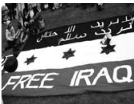
Den irakiske modstand mærker intet til den imperialistiske statsmagts forsvinden

Det gav ikke Irak selvstændighed, men kastede blot Irak i armene på andre imperialister. USA observerede udviklingen, der var i direkte modstrid med