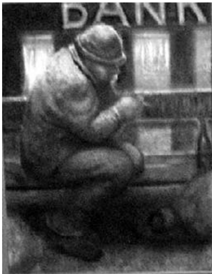
Posemand (hjemløs), Oliemaleri af Jørgen Buch

om penge, og han har fundet et sted, hvor han sidder og håber på, at de forbipasserende kaster en lille skærv af sig, og det, fortæller Jeppe, er mange flinke til.