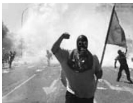
Antiglobaliseringsprotest, Genoa 2002: Statsmagten var ikke forsvundet.

De traditionelle kampformer, der har været forbundet til staterne, er slut, og