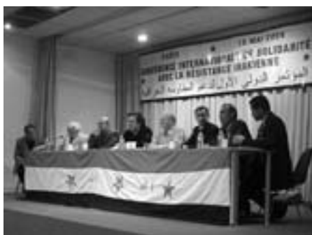
Fra konferencen i Paris

Konferencen solidariserer sig med det irakiske folks modstand i alle dens retninger og kræver besættelsesmagtens øjeblikkelige tilbagetrækning, genoprettelse af det irakiske folks uafhængighed og dets nationale suverænitæt, garanti for respekt for alle dets rettigheder, annullering af alle beslutninger truffet af besættelsesmagten samt erstatning for de øko-