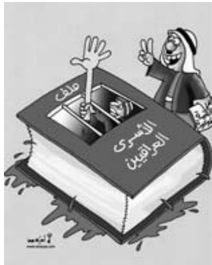
De arabiske "demokrater" og menneskerettighederne i Irak Arabisk satire.

Disse proamerikanske "analyseinstitutter" i Mellemøsten, som alle støttes af USA, beskæftiger sig på overfladen med demokratisering, menneskerettigheder, udviklingsforhold osv., men deres virkelige virke er – ud fra en angivelig akademisk og "demokratisk" vinkel – at drive propaganda for det amerikanske demokrati, altså den ame-