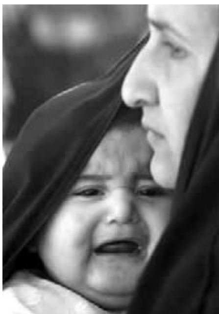
Irakere under besættelsen

Samtidig fortsætter den israelske aggression mod palæstinenserne og ulovlige besættelse af Palæstina. En ny stor forbrydelse begås mod det palæstinensiske folk af slagteren Ariel Sharon, der støttes af USA – en forbrydelse, som accepteres af EU og de øvrige imperialistiske stormagter. Også den danske regering og det sociaidemokratiske 'regeringsalternativ' tier over for dette folkemord.