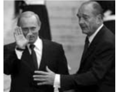
Chirac og Putin: "Krigsmodstandere" blev besættelsestilhængere

At udnævne den 30. juni til den officielle slutdato for besættelsen er ikke en mindre joke. De amerikanske besættelsesstyrker opretholdes i fuldt omfang, de øvrige internationale besættelsespartnere bliver der også, og Bush