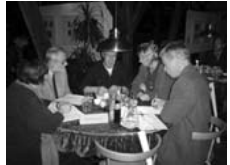
Stenvad centret Nørre Djurs: Kommunale chefer drøfter aktivering

passivt til, mens denne udvikling fortsætter. SiD glemmer til gengæld, at det var Nyrup-regeringen, der i 1993 indførte den arbejdsmarkedsreform, der fratog de arbejdsløse genoptjeningsretten ved "støttet" arbejde, hvilket netop er årsagen til, at det kan betale sig for kommunerne at benytte sig af kassetænkningen.