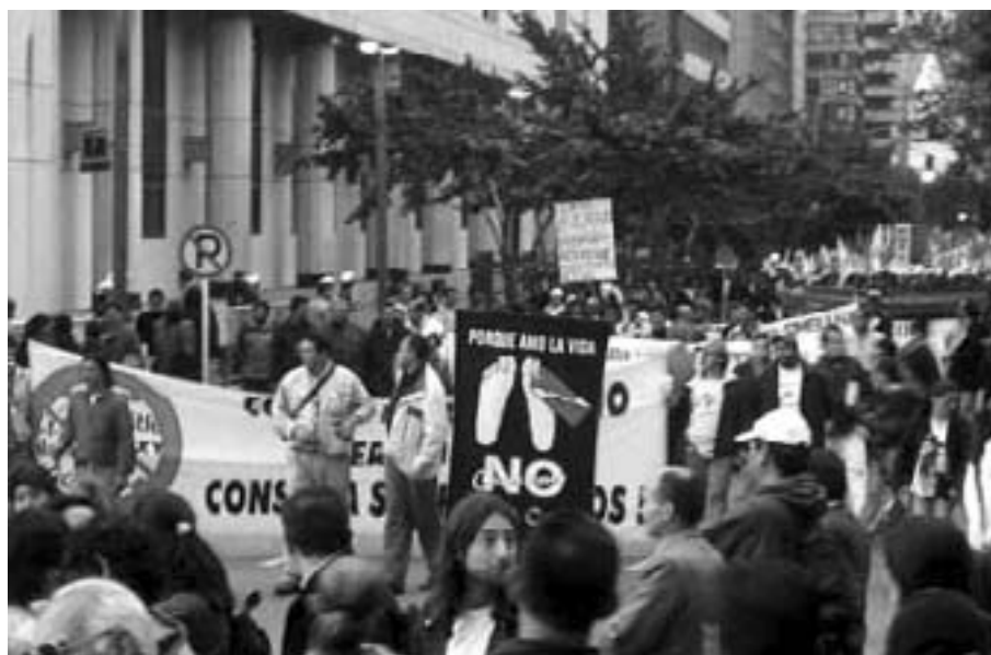
Protest mod Coca Colas dødspatroljer Bogota, Colombia, 26.februar 2004

De sultestrejkende stoppede aktionen d. 27 marts, efter at tapperiets ledelse gav en usædvanlig indrømmelse: Ledelsen fik udarbejdet en avisreklame, hvis formål var at tage modet fra AUC's dødstrusler mod de strejkende. AUC havde sendt en pressemedde-