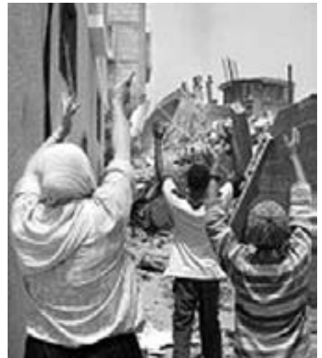
Palæstinensisk mor og hendes sønner protesterer mod de israelske bulldozere i Rafah, 15. maj 2004

Besættelsen af Palæstina og besættelsen af Irak har mange lighedspunkter. USA anvender på alle felter israelske erfaringer. De israelske erfaringer med indtrængen i byer og kampe i civilområder blev f.eks. anvendt i Falluja, hvor USA led nederlag. En rapport om belejringen af Beit Hanoun fra 15. maj til 30. juni 2003 kunne næsten ligne en generalprøve på Falluja, hvor over 600 irakere blev massakreret. Der er tale om krigsforbrydelse og kollektiv afstraffelse.