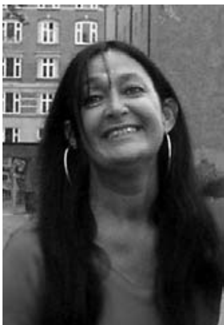
Annisette fanget af KP i Fælledparken 1. maj i år