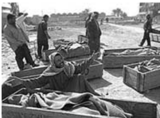
Hilla, Irak 4. april 2003

lukker øjnene, og ser ligene af irakiske fiskere fra en fattig lerklinet landsby skudt af danske soldater fra Camp Eden