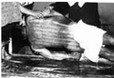
Iraker torteret til døde i amerikansk varetægt