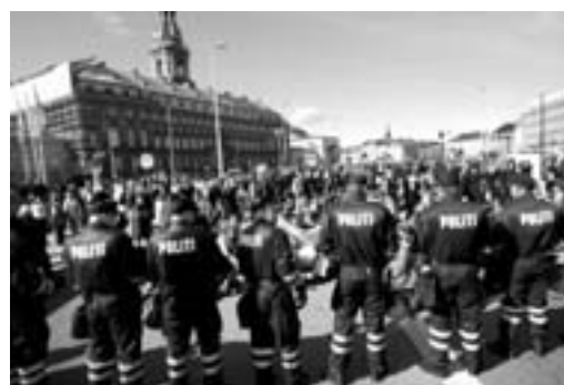
Foran Folketinget 21. marts 2003

Brudstykker fra gader, demonstrationer kommer til mig i natten og jeg hører stemmer, husker taler politi i kampuniform