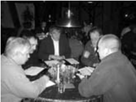
Stenvad centret Nørre Djurs: Politikere drøfter aktivering

På kun tre år er udviklingen af uordnede arbejdspladser i kommunerne steget med 30 pct. Med ekstraordinære arbejdspladser menes job, som er offentligt støttet. I nogle tilfælde opnår de ansatte med kommunens støtte arbejde på overenskomstmæssige vilkår – i andre tilfælde ikke. Hvad der gælder for begge slags ansættelser, er, at de ikke genoptjener dagpengereetten. Det vil sige, at de efter afviklet ansættelse havner i den stadig udsigtsløse tilværelse i arbejdsløshedskøen, hvor de efter senest fire års arbejdsløshed ender som kontanthjælpsmodtagere.