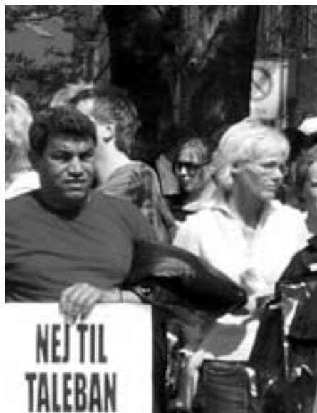
Karen Jespersen og Giordano Bruno

Men den 9. maj vælger hele det danske venstre foruden APK at demonstrere mod et lidet islamistisk parti, når dette demonstrerer mod USA. Og dette under den pågående (danske!) okkupation af Irak! Og sammen med udtalte danske okkuperings fortalere og racister! Men har I da ingen som helst sans for politiske proportioner! Hvad I selv mente at demonstrere mod eller for er en sag. Hvordan I opfattes er en helt anden. (Hvis I nu har begrebet nogen ting af Marx, så er det ikke dialektikken i alt fald). Tror I, at I igennem denne opførsel vinder unge muslimske indvandrere eller støder dem bort? Tror I, at når I minsandten råbte "Ned med Sharon!" skaffede jer et venstre-alibi, da I stod der