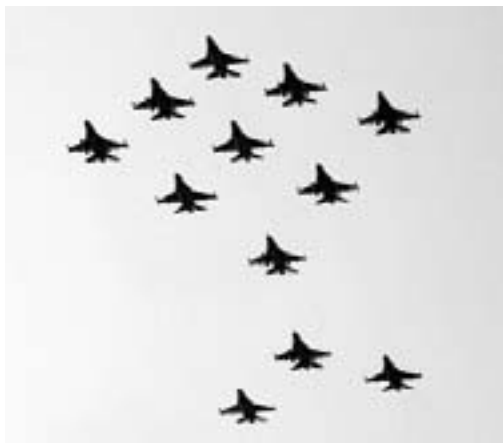
Dansk F-16 opvisning

Jeg går tur gennem øde gader efter kaffe, sure opstød en mat aften foran tv når natten angstfyldte timer er lange og månen hvisker smigrende og ekkoet af mit bankende indre runger hult mellem murene og gadens gabende porte