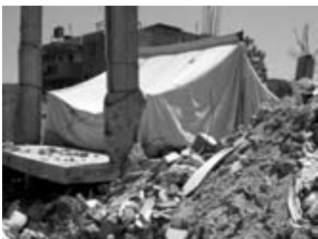
Telt slået op på ruinerne af hus i Beit Janoun, jævnet med jorden af israelerne

Beit Hanoun-regionen er på ca. 17 kvadratkilometer, heraf 10 opdyrket, mest med frugt. Der var 35.680 indbyggere, 11 skoler og 28 fabrikker. Under besættelsen blev alle adgangsveje helt lukket, der blev indført udgangsforbud, forbud eller forsinkelser af medicin og nødforsyninger, overdreven magtanvendelse med ulovlige drab og sårede som resultat, vidtgående ødelæggelse af civil ejendom, herunder boliger og erhvervsfaciliteter, destruktion af civil infrastruktur og rasing af landbrugsjord og kvægbestand.