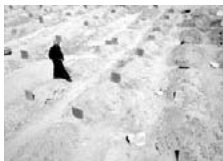
Grave i Falluja på en sportsplads efter den amerikanske massakre 9. april og de følgende dage

Om aftenen den 15. maj affyrede israelske styrker en granat mod palæstinensiske drenge, der kastede med sten.