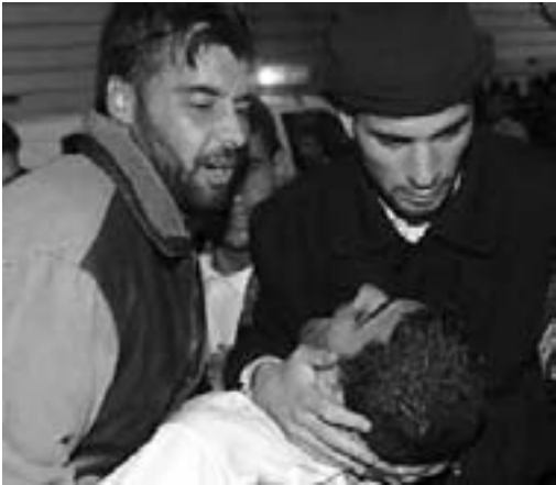
Rafah 18. maj 2004