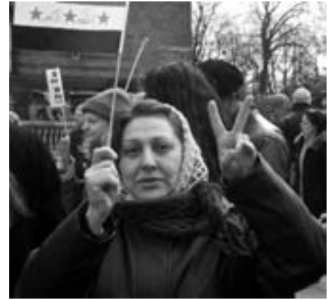
Irak vil sejre: Protest mod besættelsen København 20. marts

en besættelse. Du skal også huske, at amerikanerne har ødelagt Iraks infrastruktur og kulturarv; de forgifter irakernes drikkevand, de slår irakernes unge mænd ihjel for øjnene af deres mødre og børn, de terroriserer enhver familie i Irak. Amerikanerne, min kære statsminister, har ødelagt Irak, de har dræbt to millioner irakere under deres 13 års sanktioner, og de har åbnet Irak