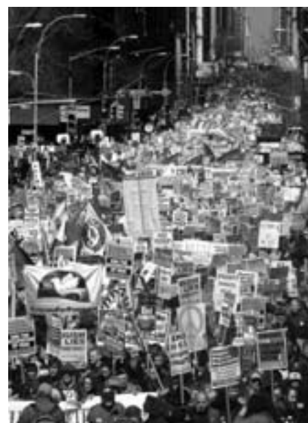
Mere end 100.000 gik på gaden i New York. Der blev demonstreret i mere end 225 amerikanske byer, og i over 60 lande.

Netavisen Kommunistisk Politik på nettet - hver dag www.kpnet.dk