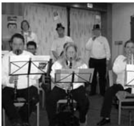
"I feel like I'm fixing to die - rag" med tekst af Country Joe (Vietnam)

eller af børn, ramt af små raffinerede stålklugler, som amerikanske politikere og våbensælgere udelukkende ønsker at kvæste og dræbe flest mulige mennesker med. Børn ligger på sygehuse i Irak og venter på at dø, fordi der ikke er medicin til dem.