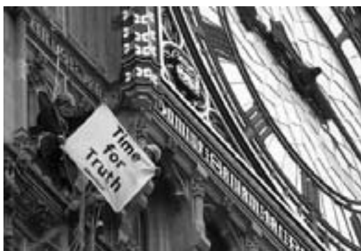
London, Big Ben: Sandhedens time er kommet!

Det var i de tre NATO- og EU-lande i Italien, Spanien og Storbritannien, hvor borgpligt-reformistiske regeringer besluttede at sende soldater til Irak for at hjælpe Washington med det folke-