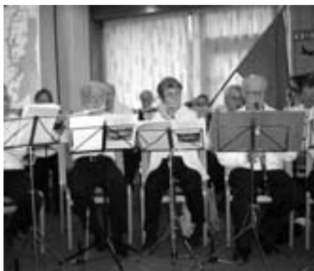
Fra koncerten "USA's forbandede krige" med Røde Horn og Röda Kapellet lørdag den 20. marts