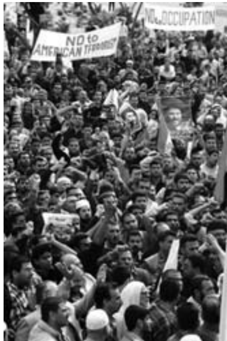
Baghdad 19. marts: Irakere demonstrerer mod besættelsen

Den, som virkelig vil bekæmpe terrorismen, bekæmper undertrykkelsen i verden, den politiske, hvor imperialismen anført af USA giver sig selv ret til med vold at påtvinge hele kloden sine diktater, og det økonomiske og sociale, hvor skellet mellem fattige og rige hele