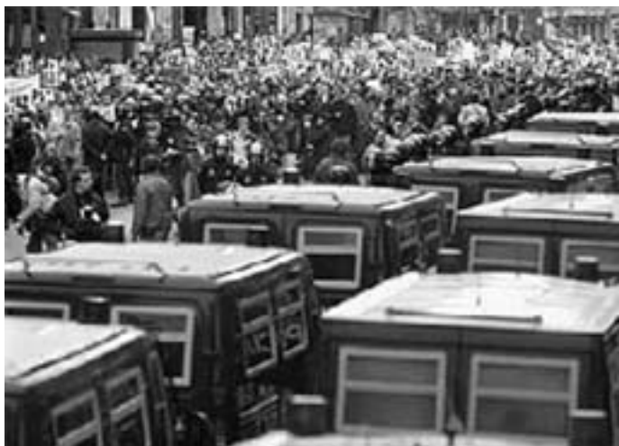
Tusinder demonstrerede foran Aznars Partido Populares hovedkontor i Madrid natten før valget den 14. marts

har siden den 11. september 2001 været et blodigt anliggende for menneskene i lande som Afghanistan, Irak og Palæstina.