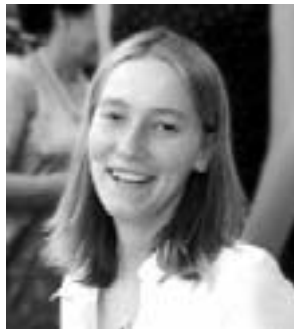
Rachel Corrie 1979-2003

død. Og det viser, at Bushregeringen kujonagtigt hermed giver Israel tilladelse til straffrit at angribe amerikanere.