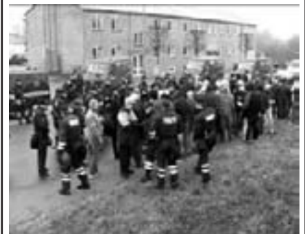
Politi omringer nazister

De danske nazister gør sig stadig mere synlige - og er gået over til fysiske overfald på antifascister og venstreorienterede.