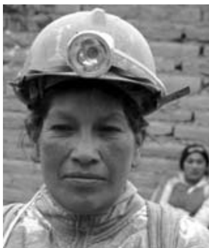
8. marts, Argentina

- Det er på mange måder et sygt samfund, vi lever i. Kvinder bliver dagligt ydmyget, og som om det ikke er nok, så bliver vi regeret af et bundt krigsforbrydere!