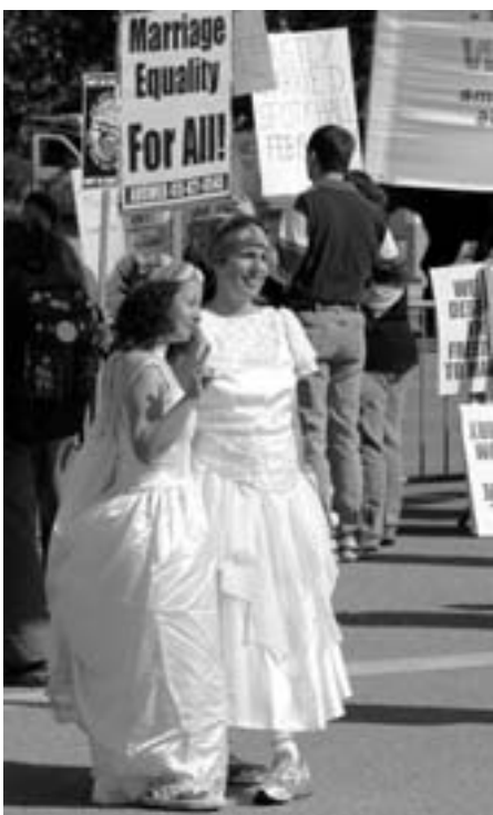
Protest mod Bushs forsøg på at splitte USA af kønspolitiske linjer