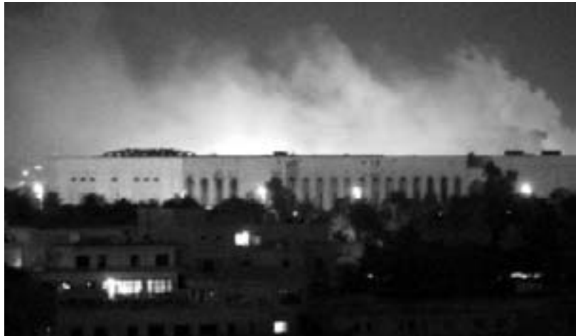
Raketangrebet på det amerikanske hovedkvarter i Bagdad op til forfatningsvedtagelsen

Efter talrige forsinkelser og udskydelser og under fortsatte angreb på besættelsesmagtens hovedkvarter i Bagdad, hvor underskrivelsen af en ny amerikansk dikteret forfatning skulle finde sted, blev den endelig sanktioneret af det såkaldte regeringsråds 25 medlemmer i mandags, knap to uger før årsdagen for krigs- og besættelseskoalitionens angreb på Irak.