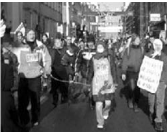
8. marts demonstration i Moskva