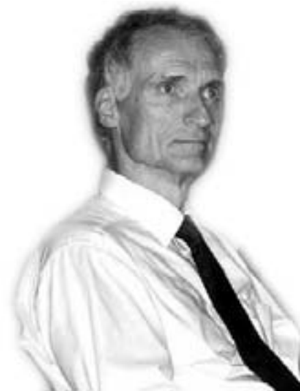
Minister for social og etnisk grøftegravning Bertel Haarder

I dag er det sådan at enhver integrations- eller indvandrerpolitik i lige så