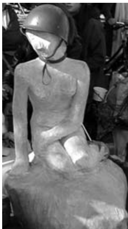
Den hjelmmede havfure

Nogen boligforeninger har luftet tanken om at indføre kvoter for, hvor mange indvandrere de vil have i deres bebyggelser. Der er sært nok tale om boligforeninger, hvor der i forvejen ikke bor mange indvandrere. Begrænsningen af andelen af indvandrere skulle myndighederne og boligforeningens bestyrelser jo have tænkt på i Gjellerup, Voldsmose og i Mjølnerparken og andre boligområder, der har fået lov til at udvikle sig til indvandrerghettoer. Men de kommunale myndigheder har råderet over en fjerdedel af alle boliger i de almennyttige boligområder. Og de fortsætter med at sende boligløse indvandrere og flygtninge de samme steder hen, vel vidende at det skaber stadig større problemer. I øvrigt sender man også boligløse danskere ind i disse