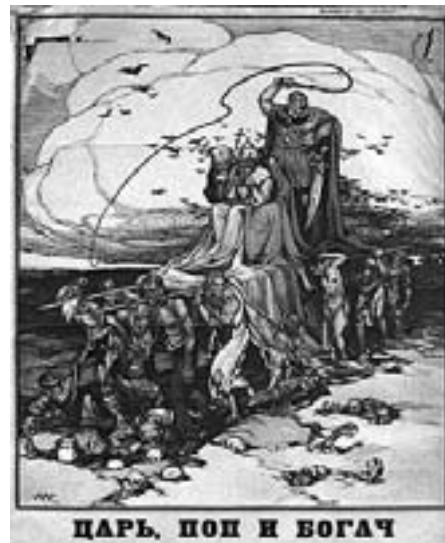
Tsaren, Præsten og Den Rige Antireligiøs plakat fra den russiske revolution.

I dagens verden er det i første række de imperialistiske lande og stormagter med USA som den suveræne nr. 1, der undertrykker de arbejdende masser og driver rovdrift på menneskenes arbejdskraft og på verdens ressourcer. Vi ser det i Irak, hvor den imperialistiske krig er blevet brugt for at få magt over verdens olieressourcer og kæmpe