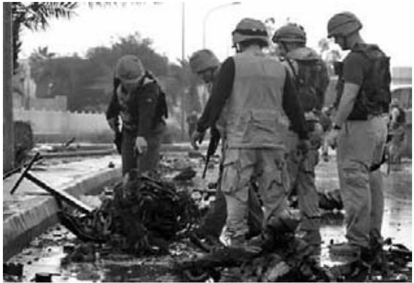
Aktiv modstand i Irak: Bombe mod rekrutteringscenter

Med henblik på at placere vore styrker nær ved alle "hot spots" eller farlige områder i denne nyligt opdagede ustabilitetens bue har Pentagon foreslået – og dette kaldes sædvanligvis "omgruppering" – mange nye baser, inklusive