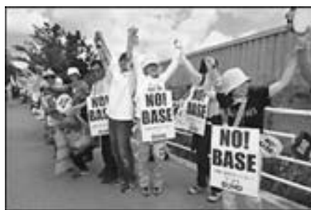
Der er vedholdende protester mod de amerikanske baser på Okinawa

Hvor det er muligt, gøres alt for at få den daglige tilværelse til at se ud som en Hollywood-version af livet derhjemme. Ifølge Washington Post serverer tjenerne i hvide skjorter og sorte bukser og sorte butterflies middag for den 82. luftbårne division i deres massivt beskyttede indkvartering, og den første Burger King er allerede åbnet inden for den enorme militærbase, vi har etableret ved Bagdads internationale lufthavn.