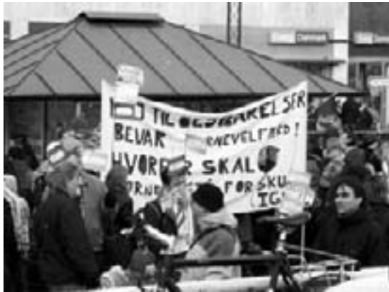
Børnefamilier i protest mod nedskæringsbudget

I Århus amt har man i de seneste 15 år skåret kraftigt ned på servicen for de syge. Lukningen af Skanderborg sygehus i 1988 var kun begyndelsen på en række lukninger og nedskæringer på sygehusområdet. Den de facto lukning af sygehuse i Grenå, Odder, Hammel og senest afviklingen af et af de store sygehuse, Århus amts-sygehus, har ført til massive problemer for de syge og patienterne. Sidste års besparelser på Århus amts sygehus på 1,4 seng pr. sygehusafdeling har ikke forbedret sagen. Nedlægning og