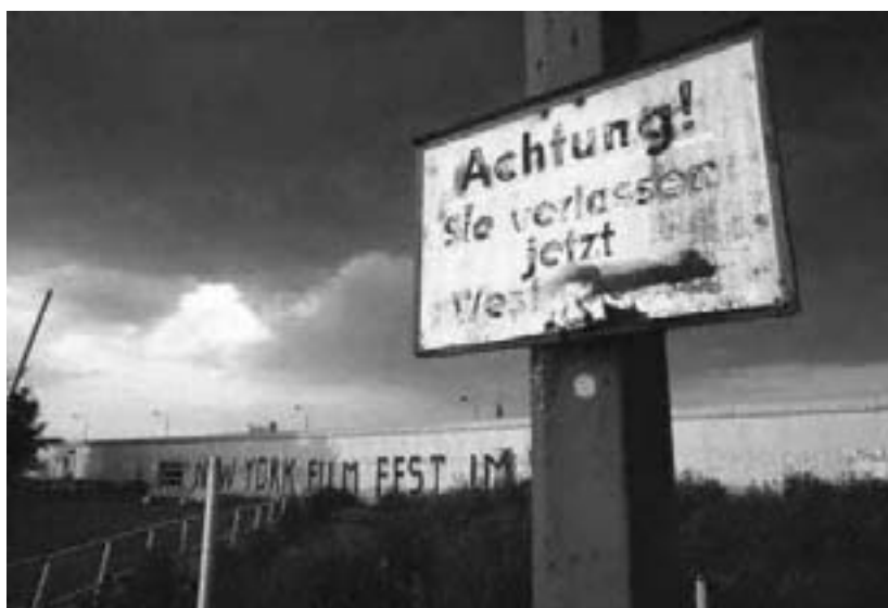
Berlinmuren i 70'erne