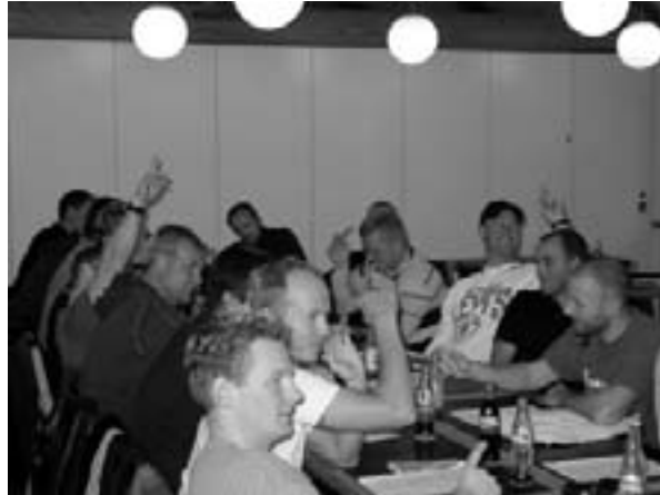
Generalforsamling i SiD klubben i Servisair november 2003 - en af de klubber der anbefaler et NEJ til overenskomsten

Vi ser hver dag, hvor store konsekvenser det har for kollegaerne at arbejde på disse skæve tider.