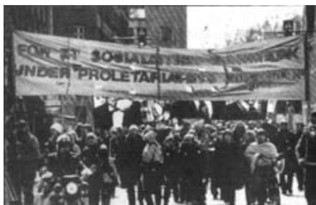
DKP/MLs 1. maj optog gennem København 1981

2. Det foregår på grundlag af det 'antimonopolistiske demokrati', som var en 'strategi' for 'fredelig overgang' til socialismen, de prosovjetiske partier udviklede efter SUKP's 20. kongres (1956). Denne 'strategi', som adskiller kampen mod monopolerne fra kampen mod deres stat, lader, som om man kan tæmme og bekæmpe monopolerne ved hjælp af deres stat og forvandle denne stat til en progressiv organisme ved hjælp af et folketingsflertal, uden revolution.